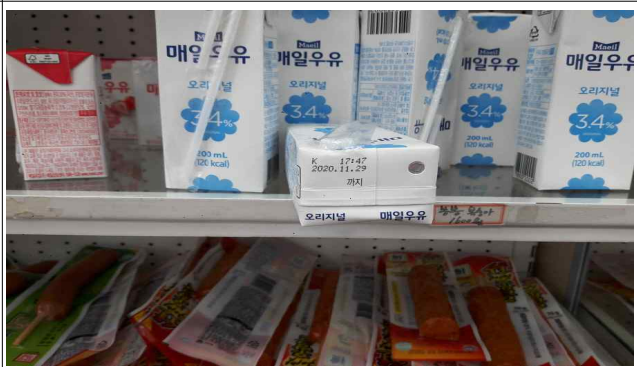
유제품 등 유통기한