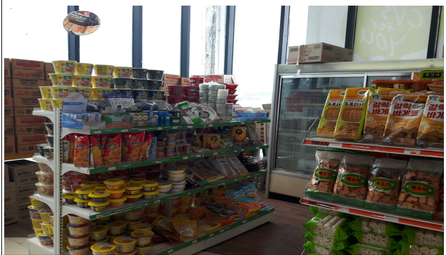
판매물품 가격표시 여부(예)