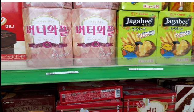
판매물품 가격표시 여부