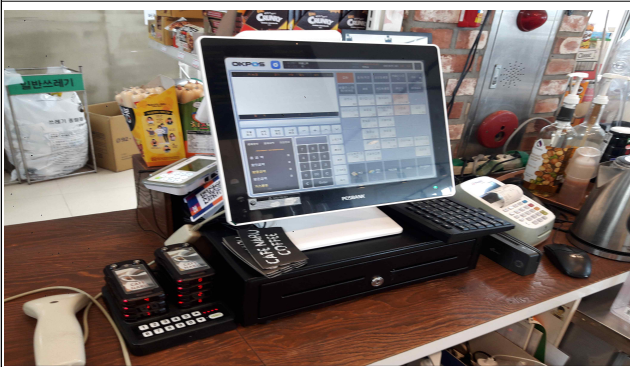
신용카드 등 계산기