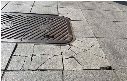
< 삼청로54 앞 보도 파손 >