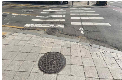
< 횡단보도 턱낮춤 및 점지블록 미설치 >