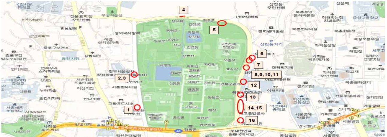
< 위치도(횡단보도 설치 미포함) >