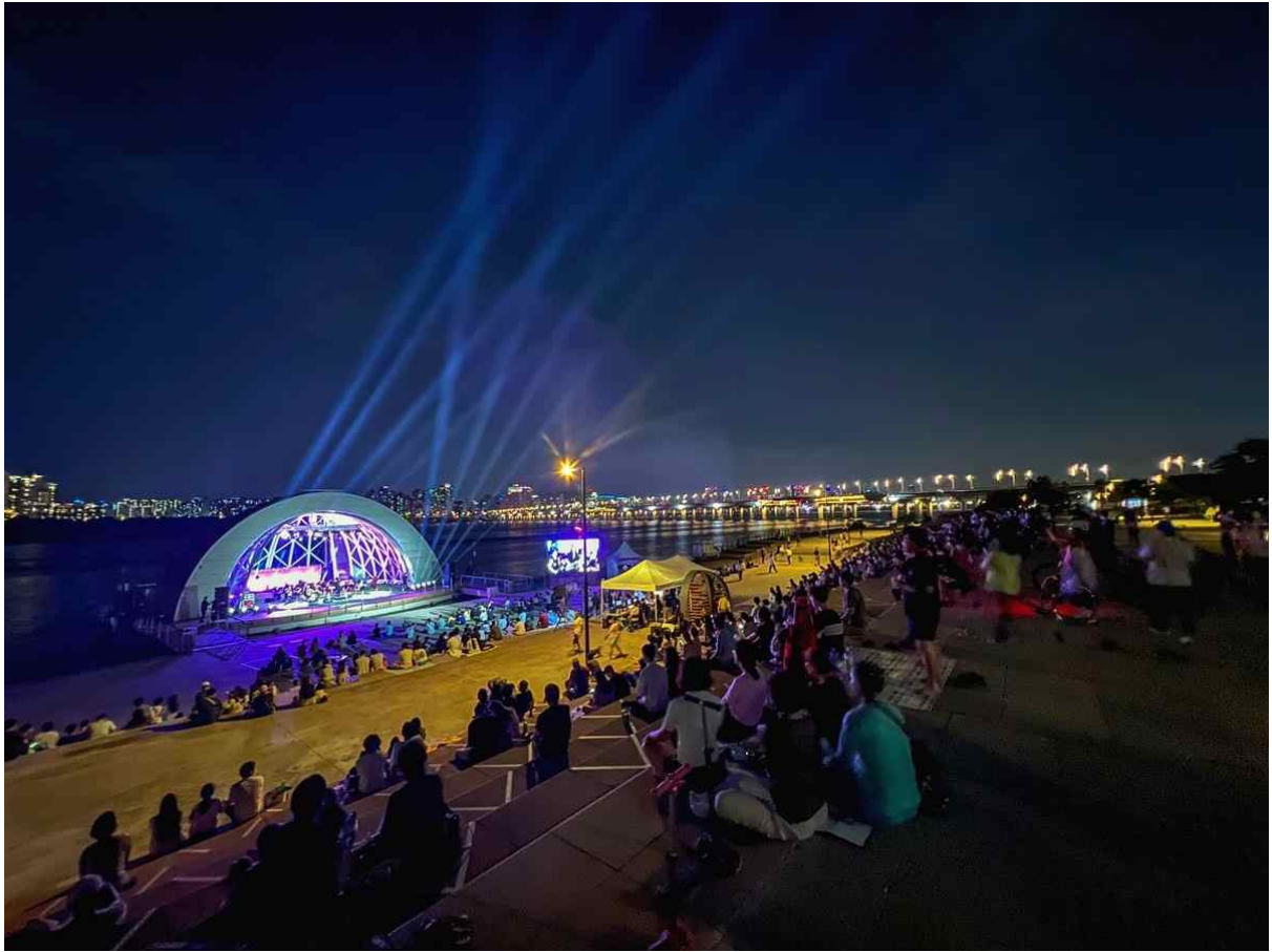
한강페스티벌 - 썸머뮤직피크닉(2022)