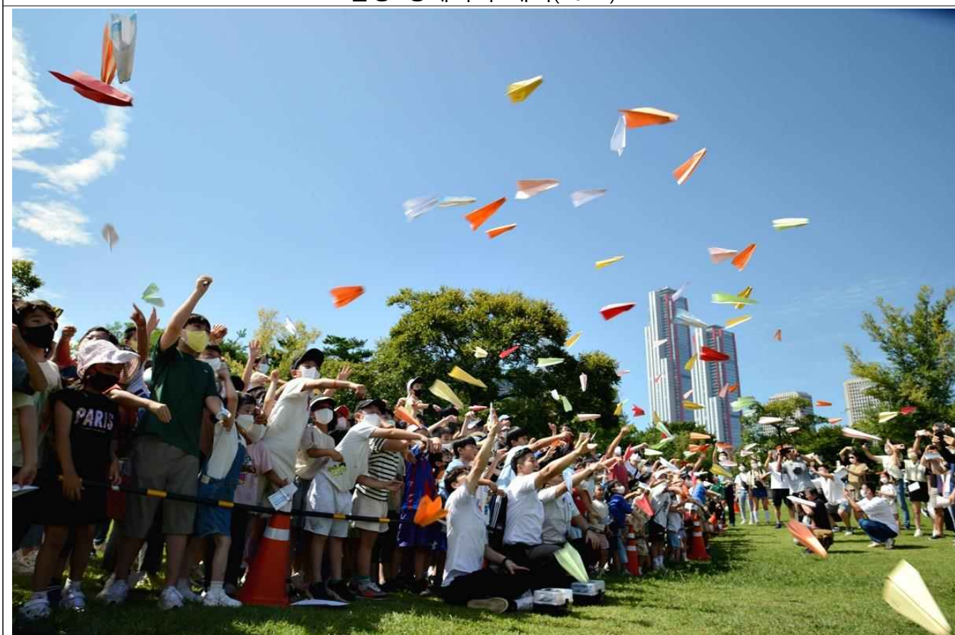
한강 종이비행기 축제(2022)