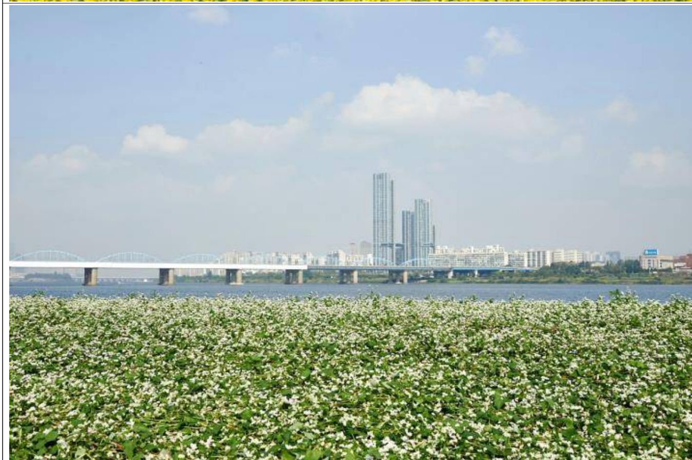
한강 서래섬 꽃 축제