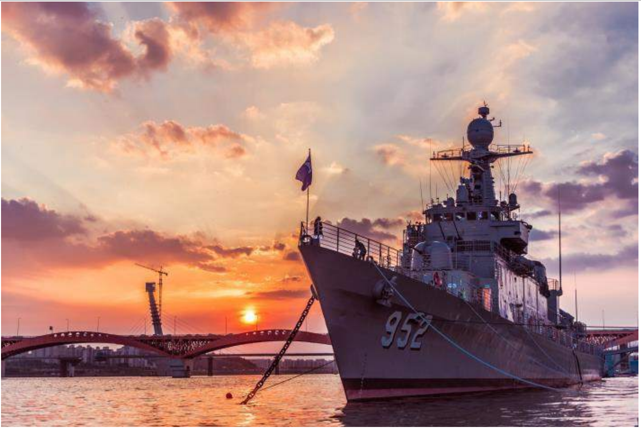
서울함 선셋축제 참고사진 (서울함공원 전경)