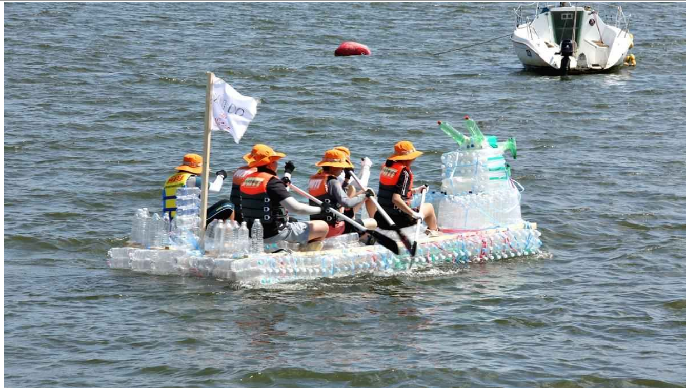
한강페스티벌 - 리사이클 뗏목 한강 건너기(2019)