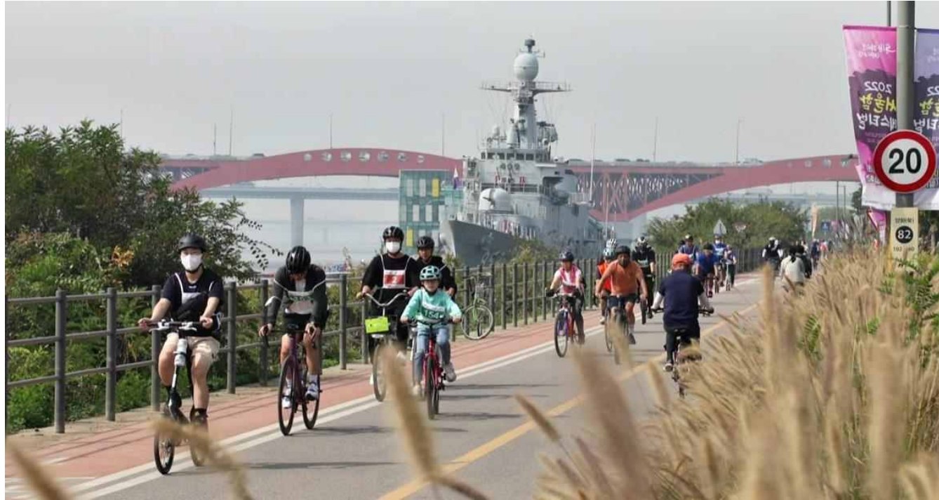
한강페스티벌 - 한가한 자전거대회(2022)