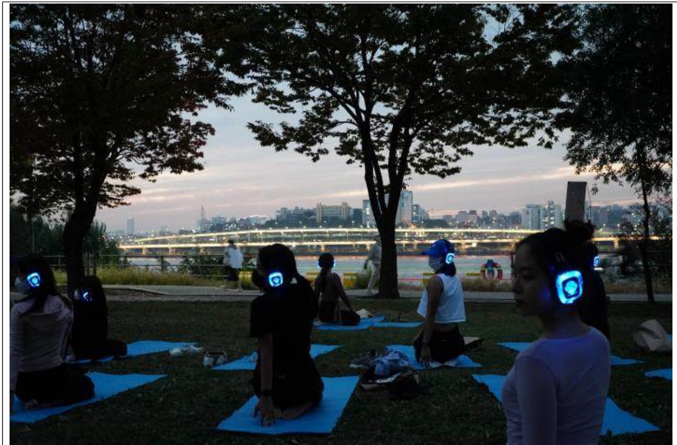
한강페스티벌 - 나홀로 요가(2022)