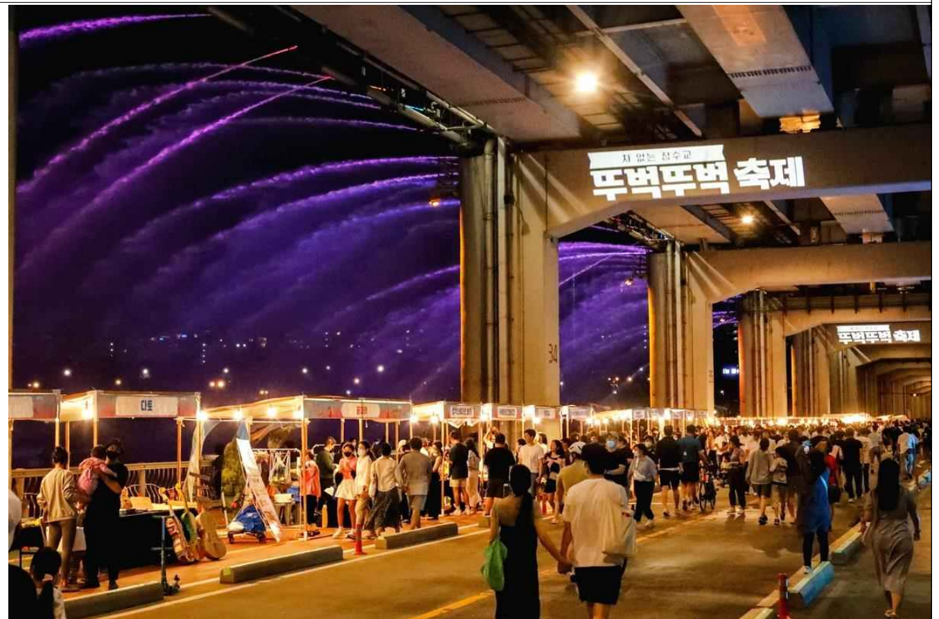
차 없는 잠수교 두벅두벅 축제(2022)