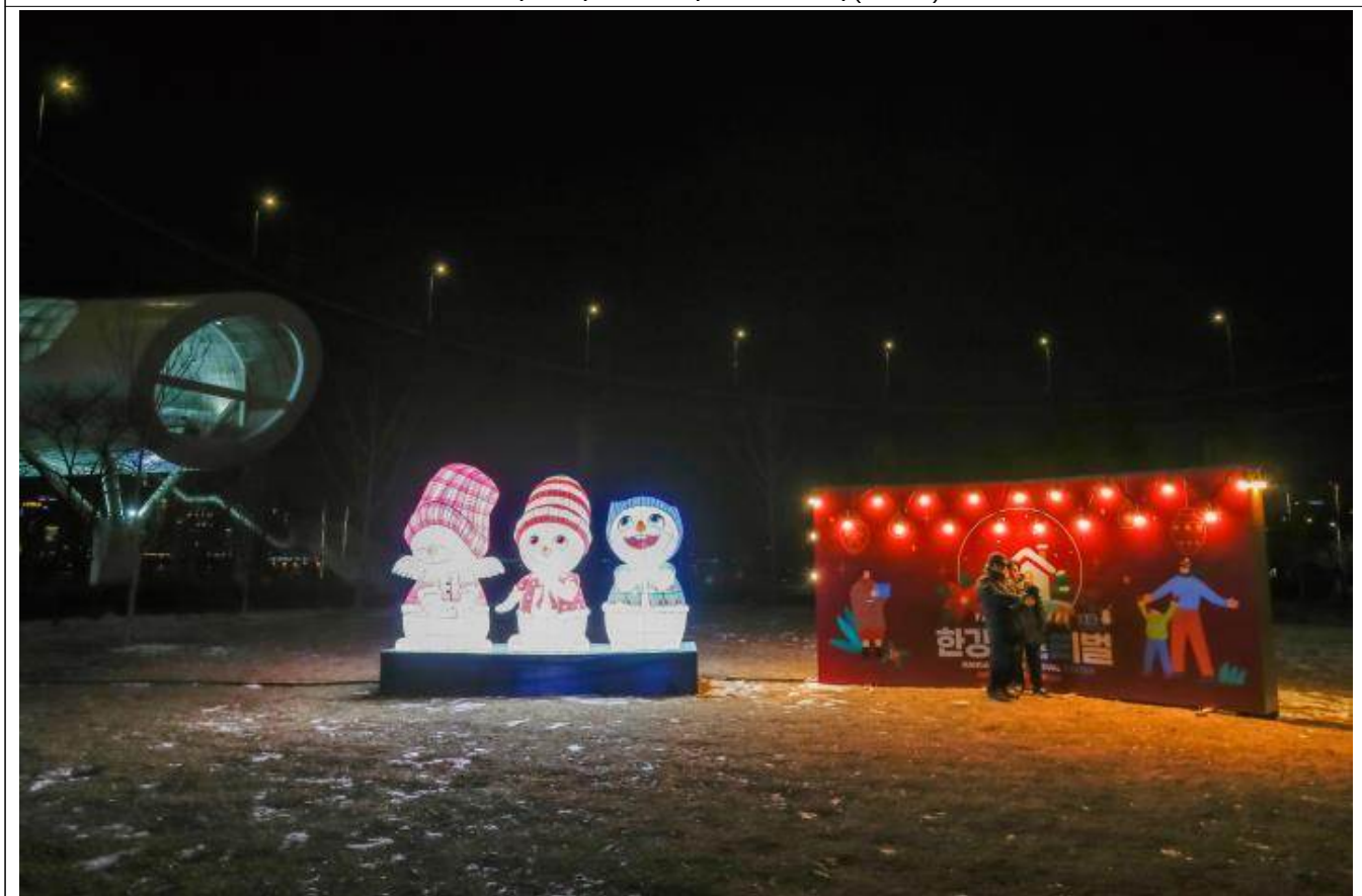
한강페스티벌 - 행복한 눈사람 빛조형물(2022)