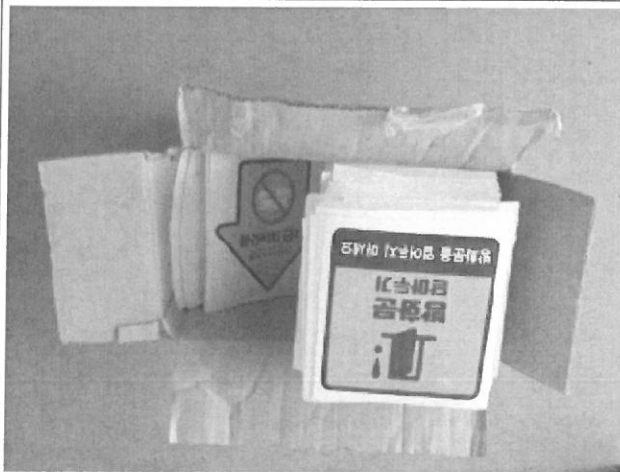
물품 사진 1