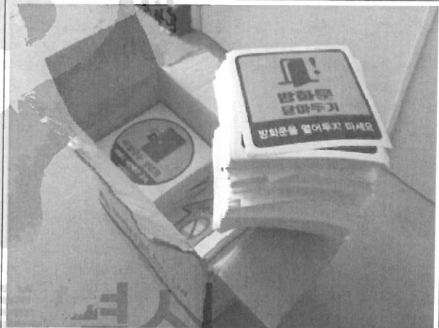
검사 진행 중 사진