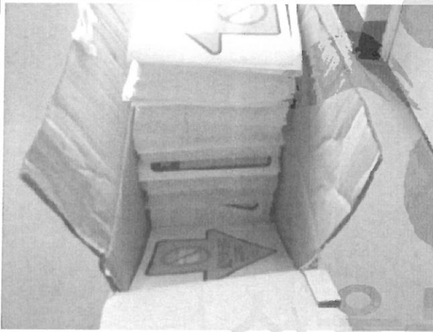
검사 진행 중 사진