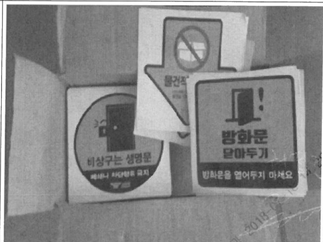
물품 사진 2