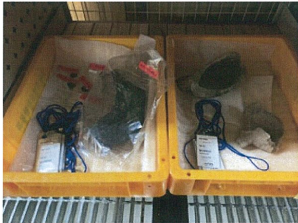
국립중앙박물관 위탁 국가귀속문화재 수장고 격납 상태2