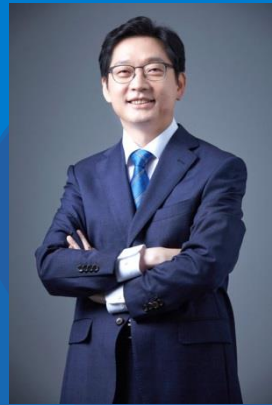
김경수 경상남도 도지사

“서울시 청년수당, 포퓰리즘 아닌 리얼리즘. 돌이켜보면 인생에서 중요한 것은 '속도'가 아닌 '방향'이었다. 청년을 믿고 신뢰할 때 새로운 미래를 이야기 할 수 있다.”