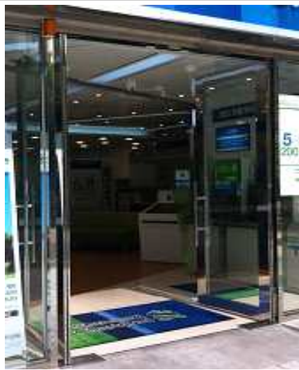
<난방기 가동하면서 5분이상 출입문을 열어놓고 영업하면 규정위반>