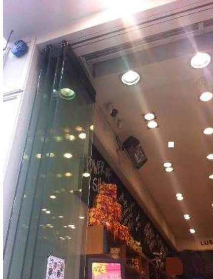
<난방기 가동하면서 출입문을 고정시켜 놓고 영업하면 규정위반>