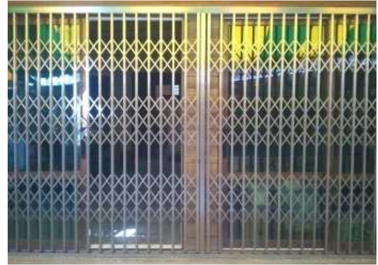
<난방기 가동하면서 외기를 차단할 수 없는 출입문을 설치하고 영업하면 규정위반> * 외기를 차단할 수 있는 문을 설치한 경우에는 규정위반이 아님