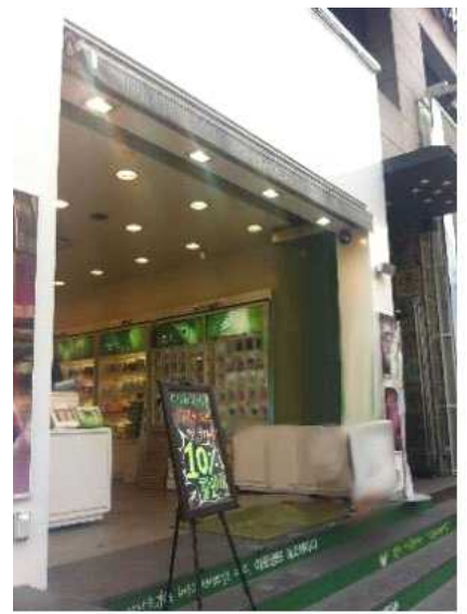
<난방기 가동하면서 출입문을 철거하고 영업하면 규정위반>