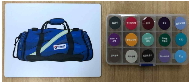
4. DMAT Bag / 5. 처치물품