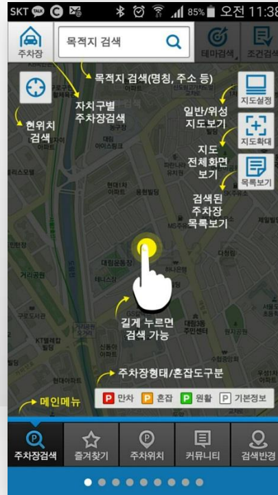
주요 기능 안내