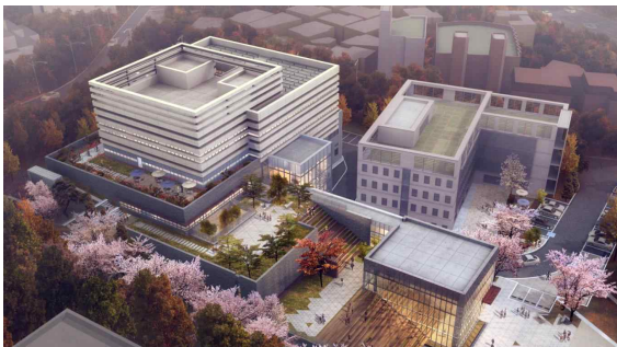
< 서울기록원 조감도 >