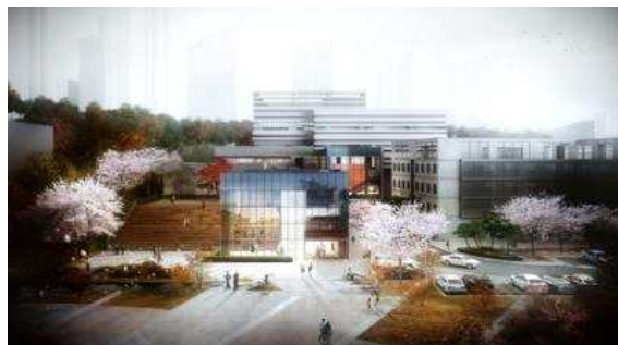
< 서울기록원 투시도 >