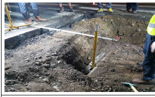
지하매설물 현황(신호등 관로 2열)