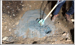
공동복구 채움재시공(6.30) 상태 및 굴착정도 확인