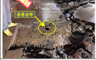
채움재 중단 지점 공동확인