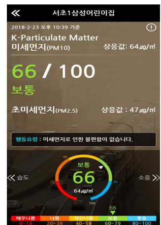
< 스마트폰 앱 >