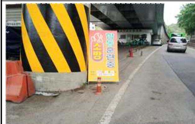
방재훈련 안내 간판 설치