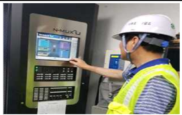
화재수신기 발령 확인