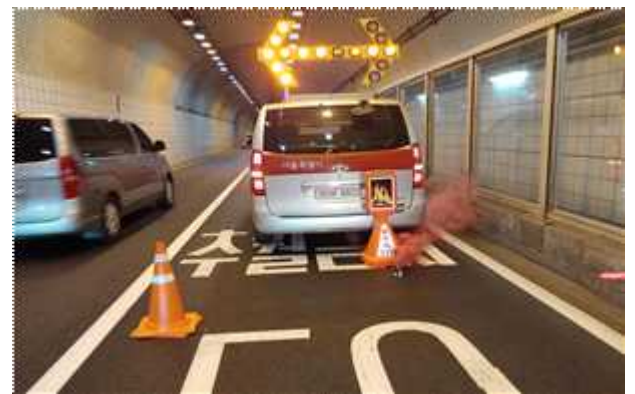
화재현장 도착 후 현장확인