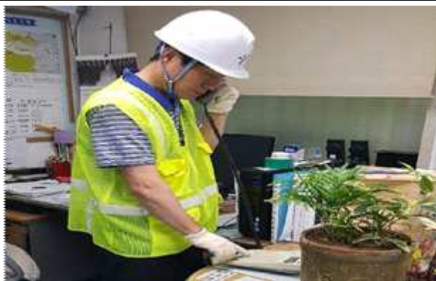
유관기관(소방서, 경찰서 등) 상황전파