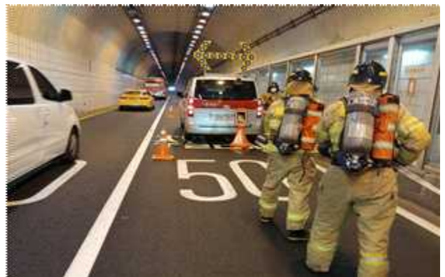
소방차도착 화재 진압