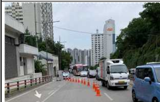
2차로 차량 통제