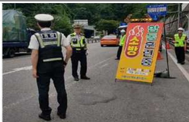
서대문경찰서 차량 통제