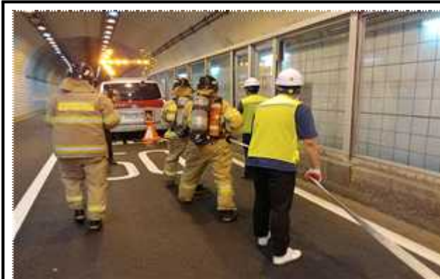
소방관 합동 진압