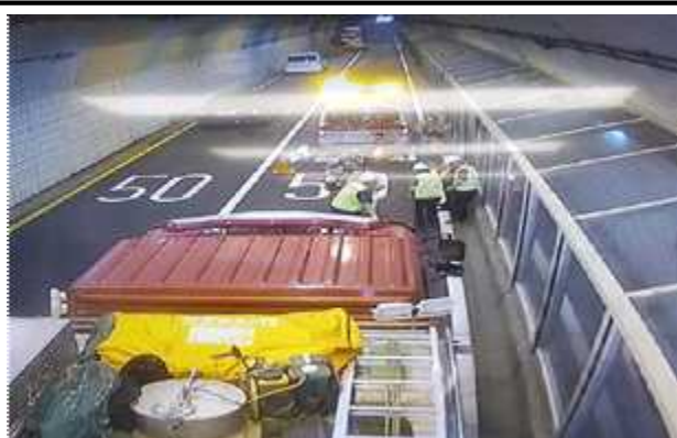
소방관 합동 진압