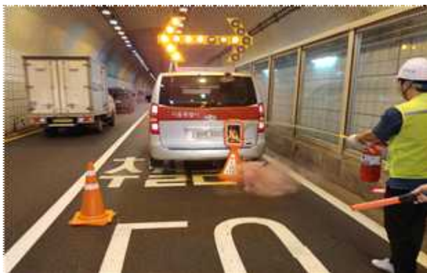
소화기 1차 화재 진압