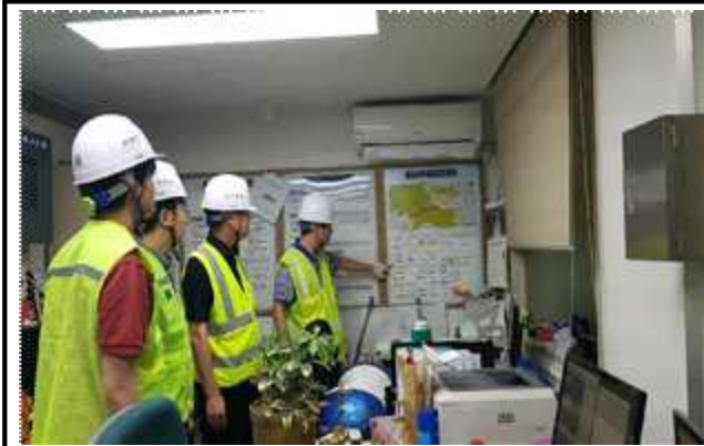
금화터널 시설물 현황 설명