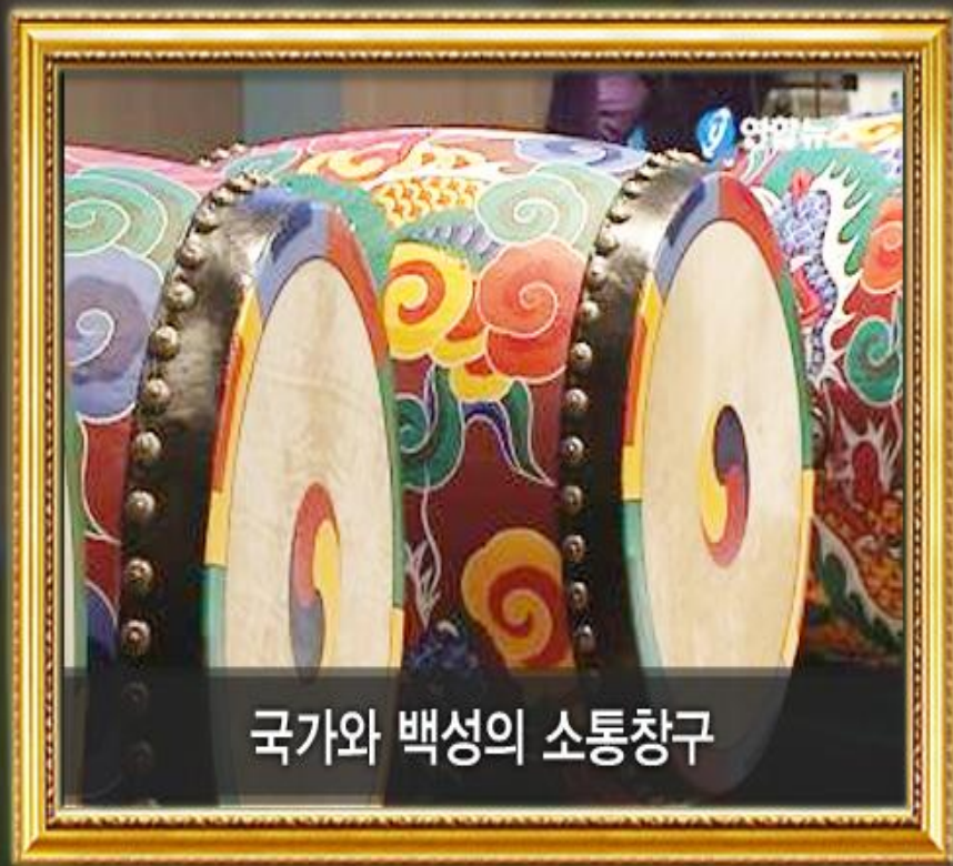
국가와 백성의 소통창구