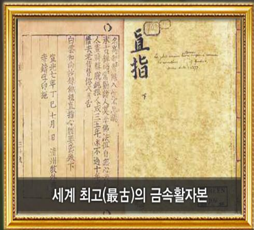
세계 최고(最古)의 금속활자본