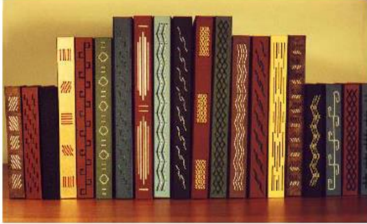
양장본 책 형식의 북앤드