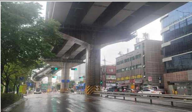
사진설명(신축이음하부 교각 표면열화)