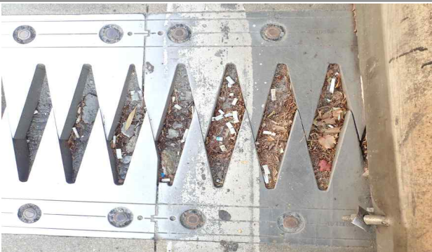
사진설명(신축이음장치 노후 편기)