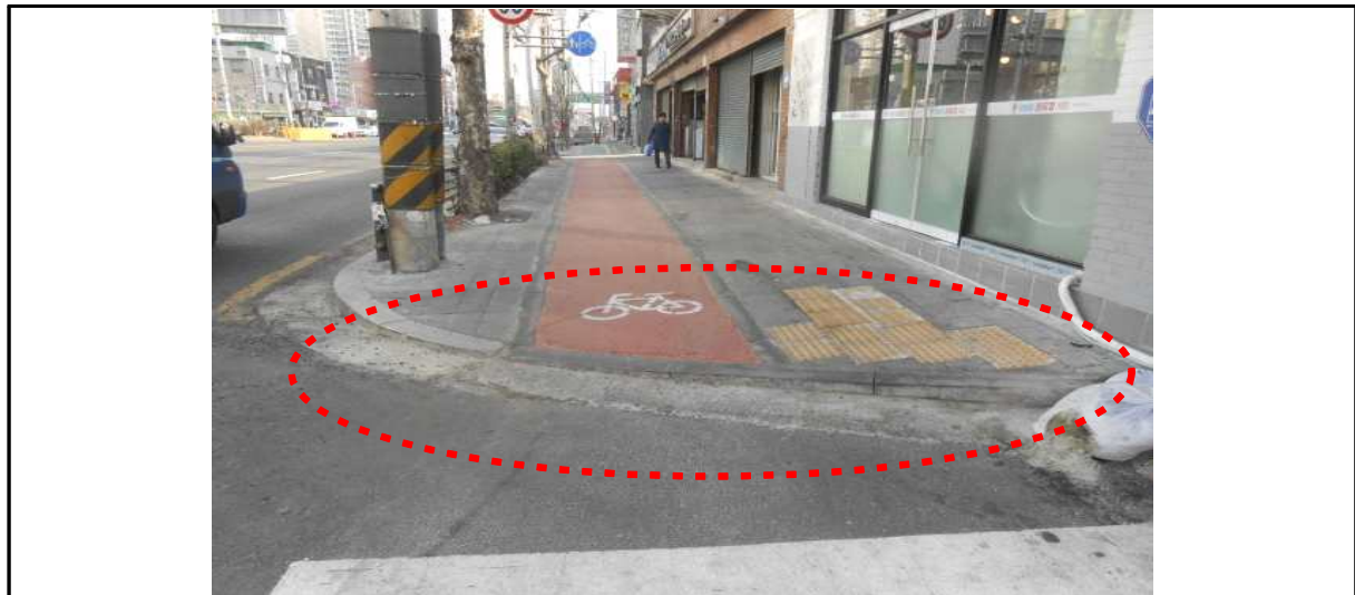
▶ 턱낮춤(0cm) 미시행