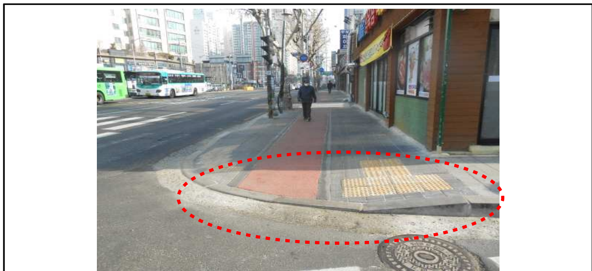
▶ 턱낮춤(0cm) 미시행