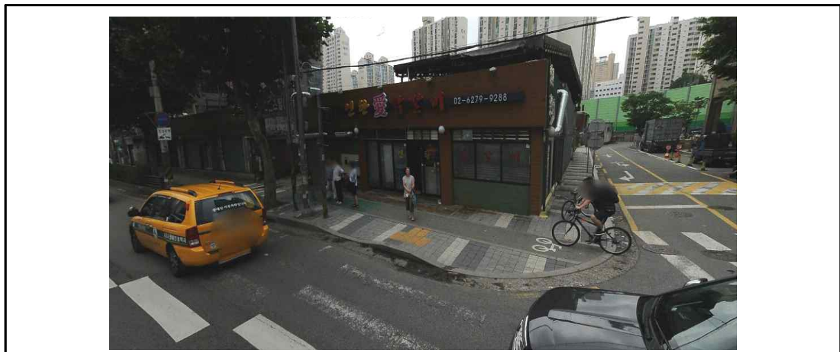
▶ 보도 공사전