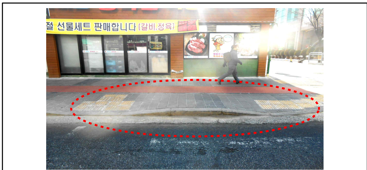
▶ 보도 공사후(기존 경계석활용 포장 사례 : 전체턱낮춤 및 점자블록 설치기준 미준수)