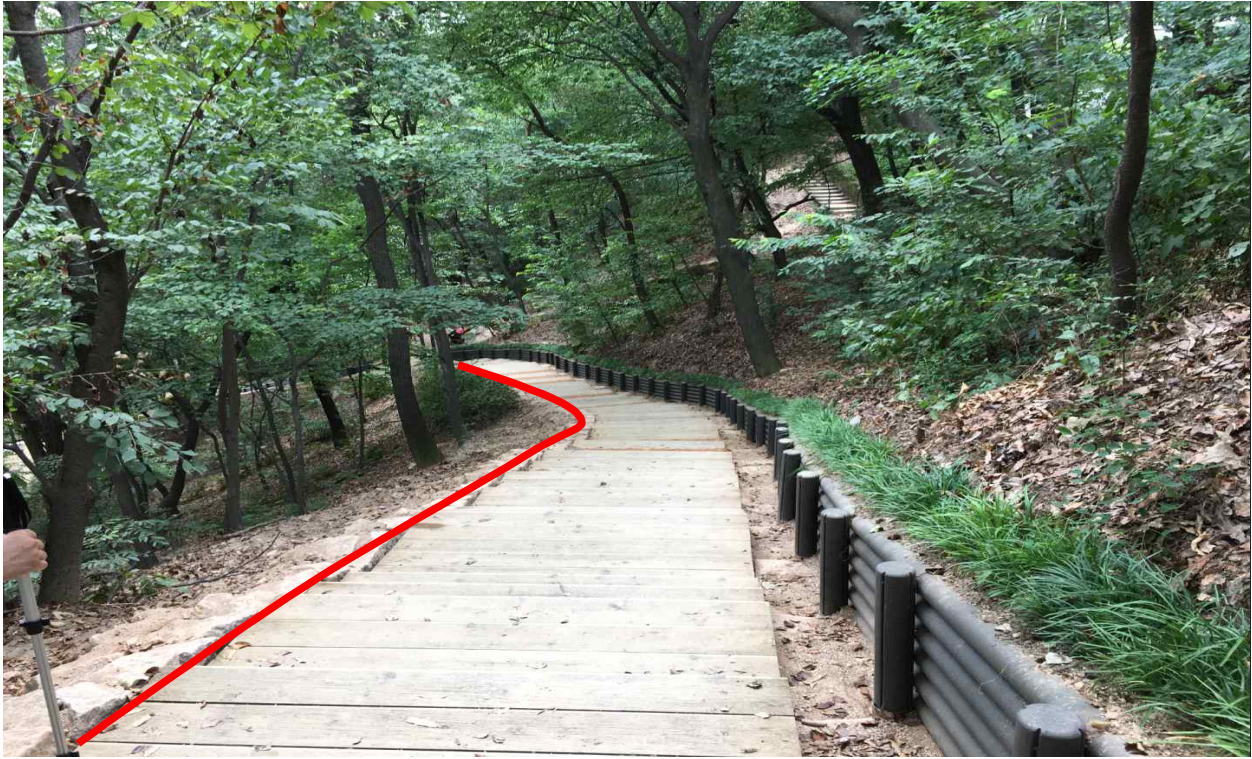
▲ 핸드레일형 안전난간 설치 대상지