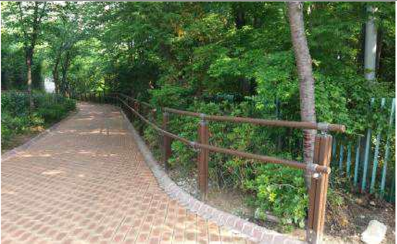
▲ 핸드레일 설치 사례사진