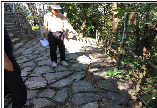
▲ 현장 점검 중