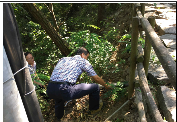
▲ 현장 점검 중