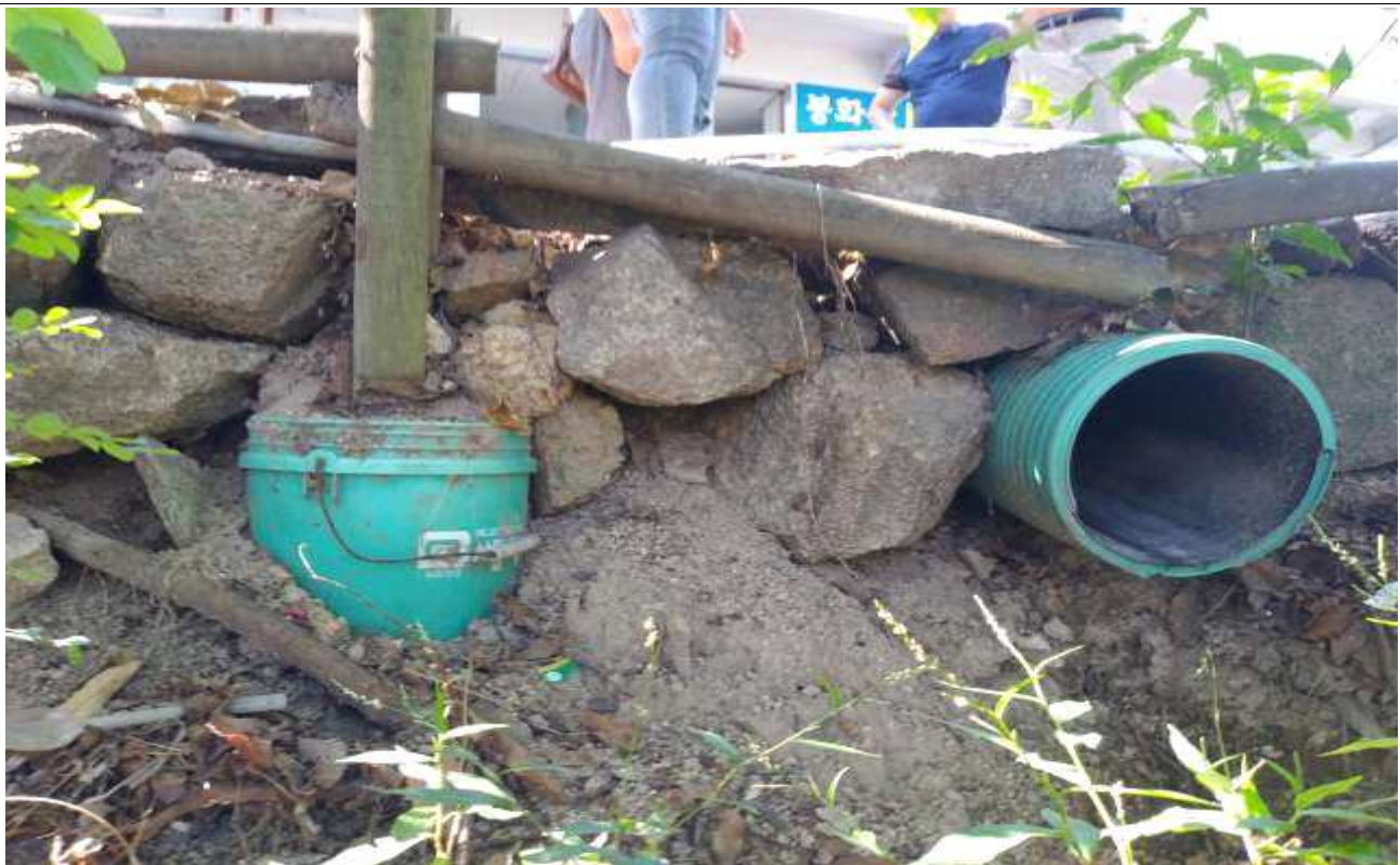
▲ 판석 하부 석축 재정비