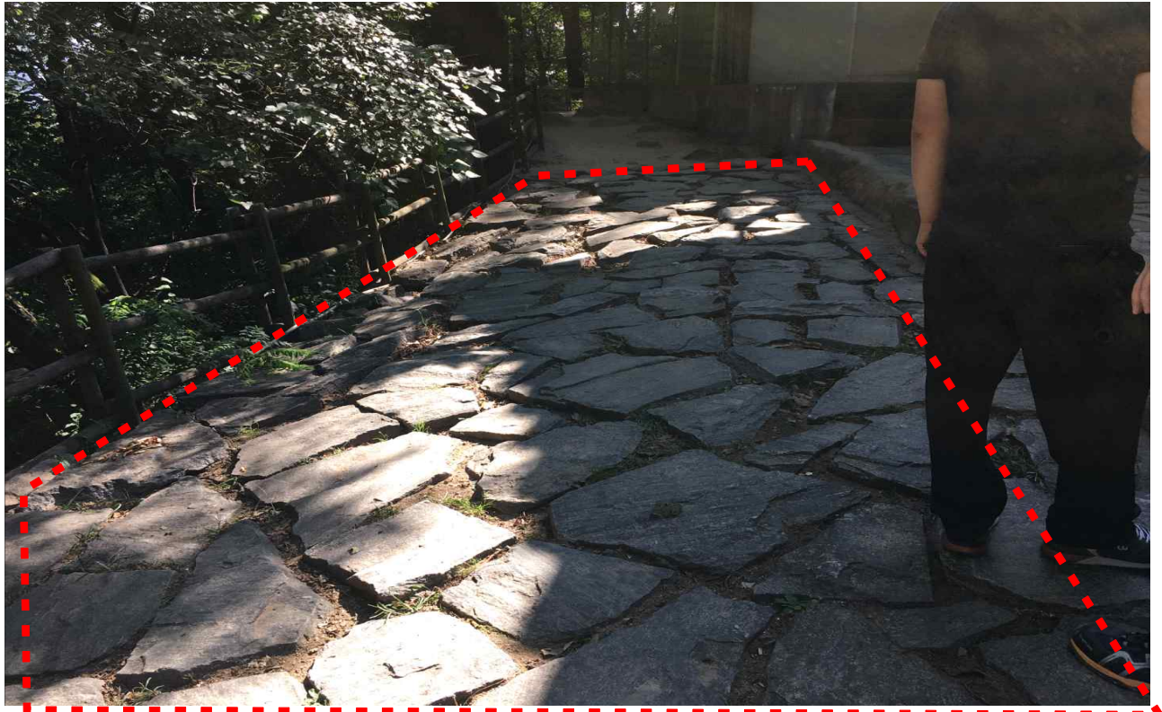
▲ 매점 앞 판석 정비