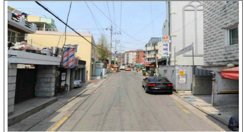
시 행 전