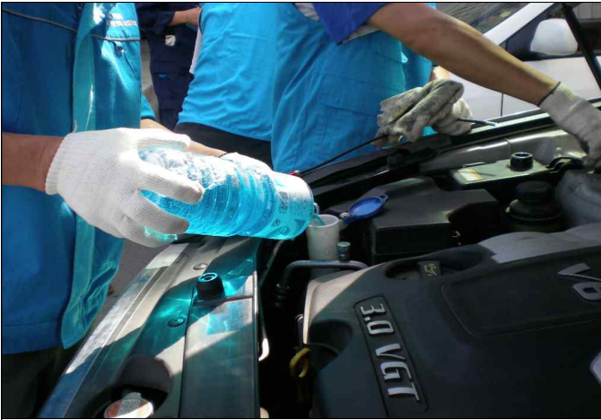
엔진오일 점검 및 보충