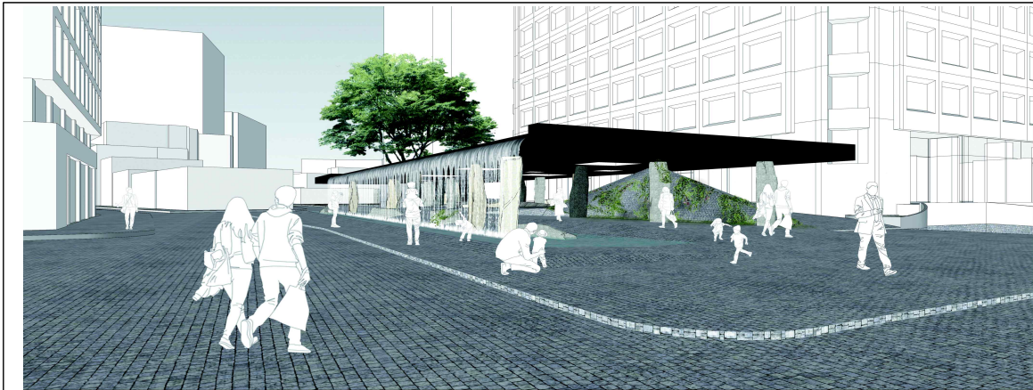
서쪽 길에서 본 전경