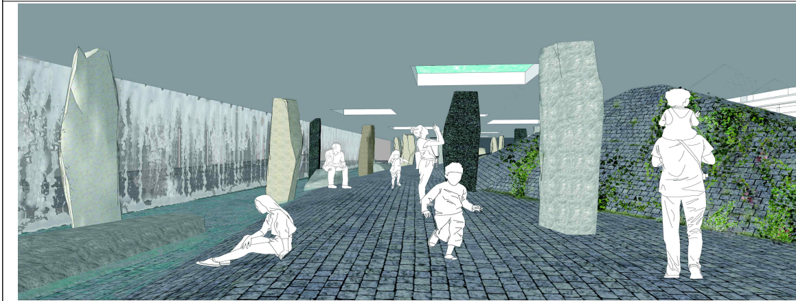
떠있는 수반 아래서 쉬고 있는 다양한 사람들 의 모습