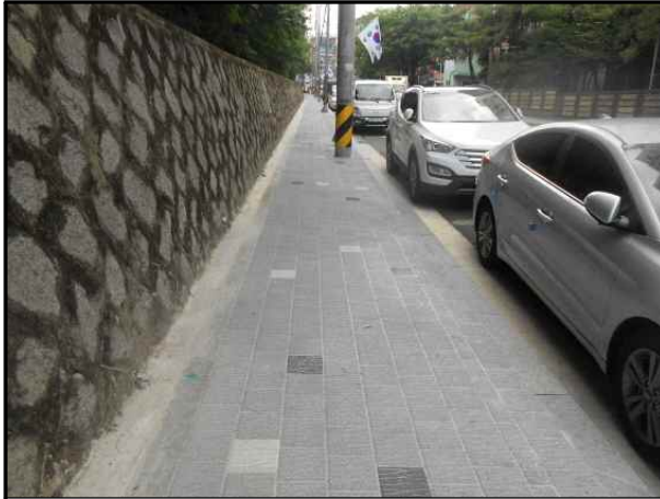
▶ 공사 구간 전경