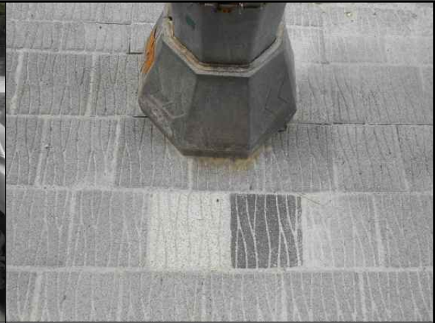
▶ 포장 경계부 정밀 시공 양호