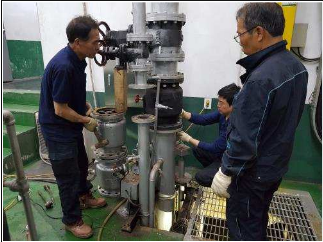
사진설명 염곡지하차도 체크밸브 설치중 - 1호