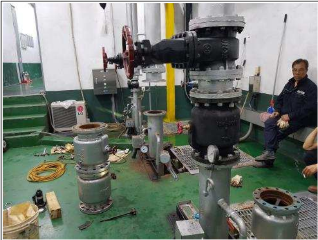
사진설명 염곡지하차도 체크밸브 설치중 - 3호