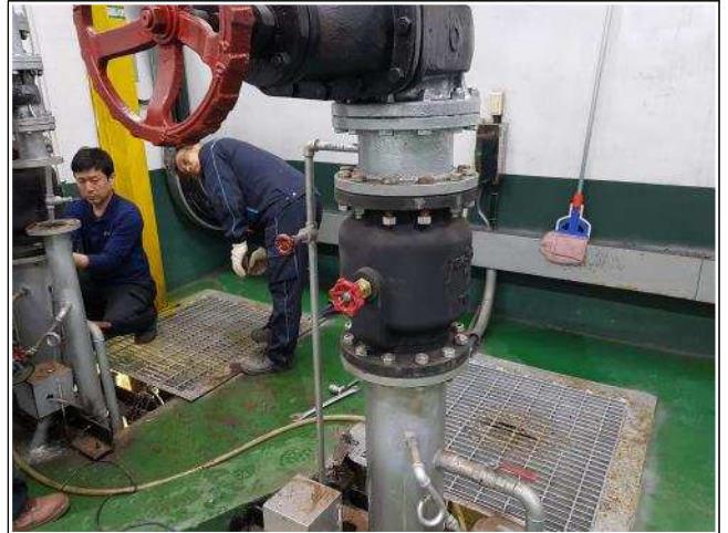
사진설명 염곡지하차도 체크밸브 설치중 - 2호