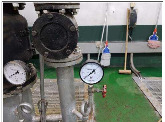
사진설명 염곡지하차도 압력계 교체완