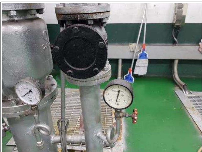
사진설명 염곡지하차도 압력계 교체전