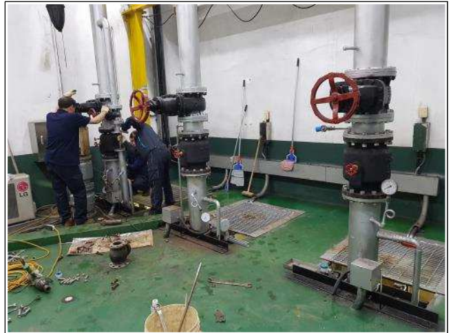
사진설명 염곡지하차도 체크밸브 설치완