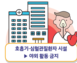
호흡기·심혈관질환자 시설 ▶ 야외 활동 금지