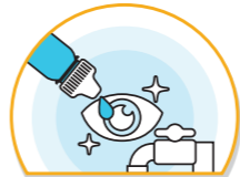
콘택트렌즈 착용을 삼가며 눈이 가려울 때에는 손으로 만지지 말고 물로 씻거나 안약 사용 힘든 신체활동 줄이고 외출후 집에 들어가면 옷, 가방 등 먼지 털어내고 얼굴, 손을 깨끗이 씻기