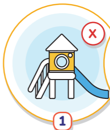
1 영유아 시설 야외수업 금지