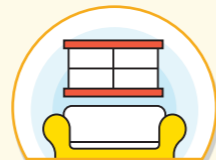
어르신 시설에서는 다음 날 예정된 실외활동으로 대체