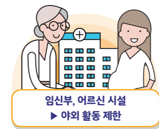
임신부, 어르신 시설 ▶ 야외 활동 제한