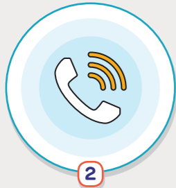
2 영유아와 어린이의 보호자 및 기타 시설 이용자의 비상 연락망 구축