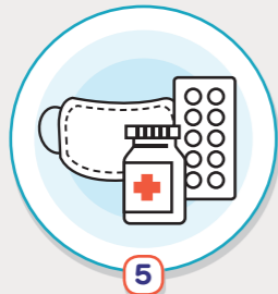
5 공기청정장치 가동 상태를 수시로 점검하고 보건용 마스크, 상비약 등의 비치 여부 점검