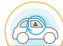
운전시 창문을 닫고 실내순환모드로 전환하며 외부공기 유입 차단