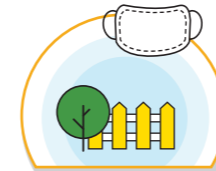
바깥 놀이 자제, 외부활동시 달리기 등 활동 최소화 신체노출이 적도록 모자, 긴소매 옷, 마스크 착용