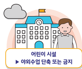
어린이 시설 ▶ 야외수업 단축 또는 금지