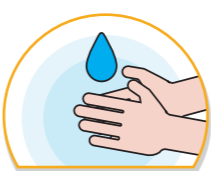
외출 후 집에 들어가면 얼굴, 손 등을 깨끗이 씻기