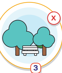
3 임신부, 어르신, 호흡기·심혈관질환자 시설 외출 및 야외 활동 금지