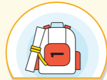
보호자 비상 연락망, 가정통신문 등을 통한 미세먼지 대응 행동 요령 공지