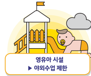
영유아 시설 ▶ 야외수업 제한