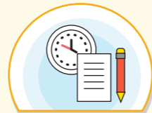
다음 날 예정된 실외 수업에 대한 수업 대체 방안 검토