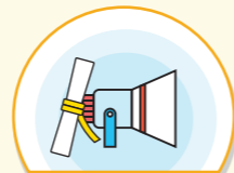
시설이용자에게 미세먼지 대응 행동요령 공지