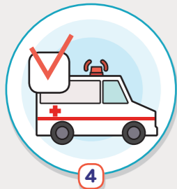
4 호흡기질환 등 민감군 현황을 파악하고 건강 상태 확인, 응급 조치 요령 등 숙지