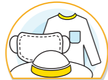
의사와 상담 후 보건용 마스크 착용, 신체노출이 적은 긴소매 옷과 모자 착용