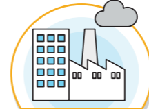
교통량이 많은 도로, 공장 등으로 이동 자제