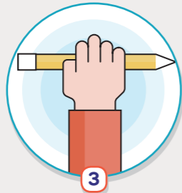
3 영유아와 어린이의 실외 수업 대체를 위한 사전 계획 마련