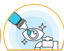
눈이 가려울 땐 손으로 만지지 말고 물로 씻거나 안약 사용