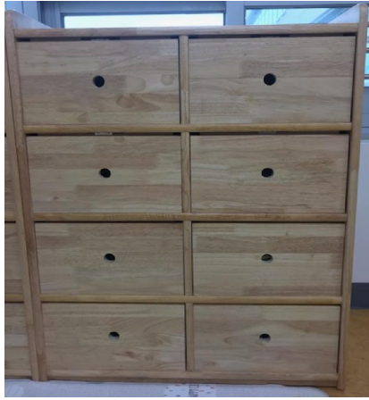
유아용교구장(재활 작업치료실) (ARD-534)