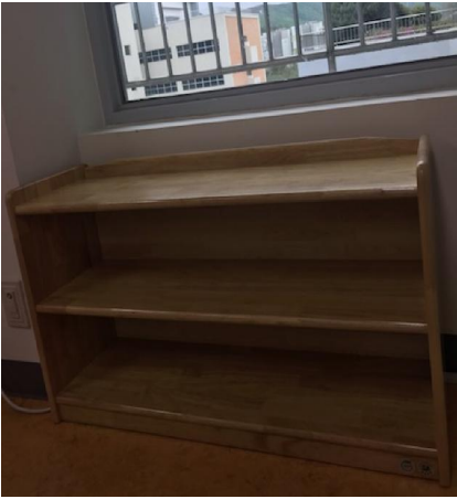
유아용교구장(재활 작업치료실) (SSGG-159)