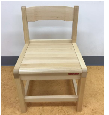
작업용 의자(재활 작업치료실) (UG-4)