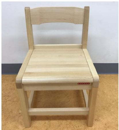
작업용 의자(재활 작업치료실) (UG-4)