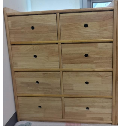
유아용교구장(재활 작업치료실) (ARD-534)