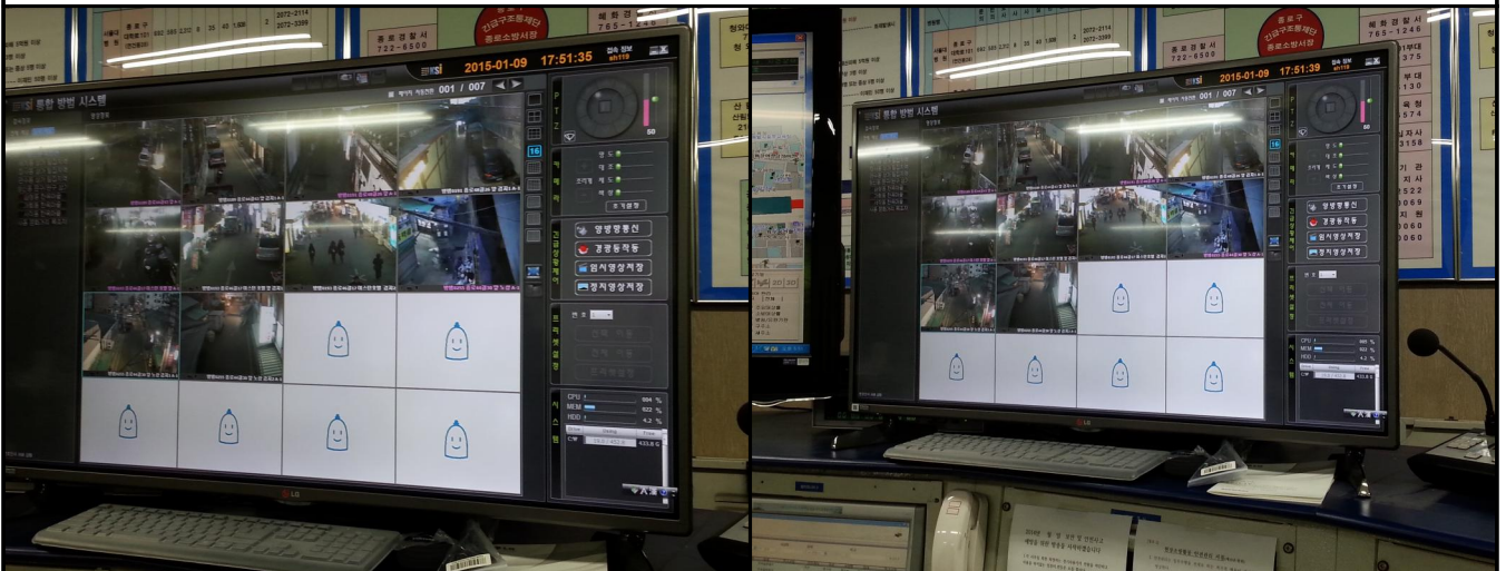
영상정보장치 설치 2