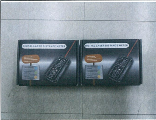
전체수량 물품 입고 사진