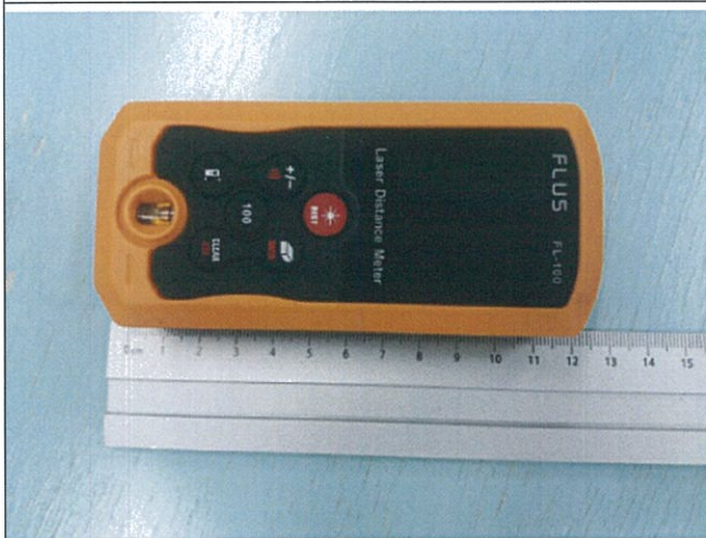
검사 진행 중(크기)