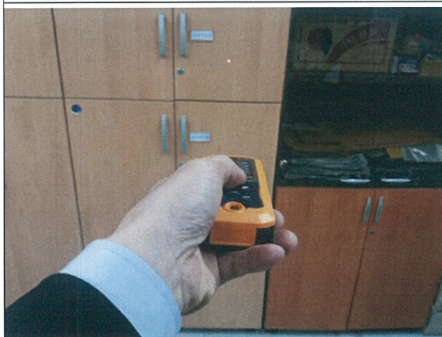
검사 진행 중(기능)