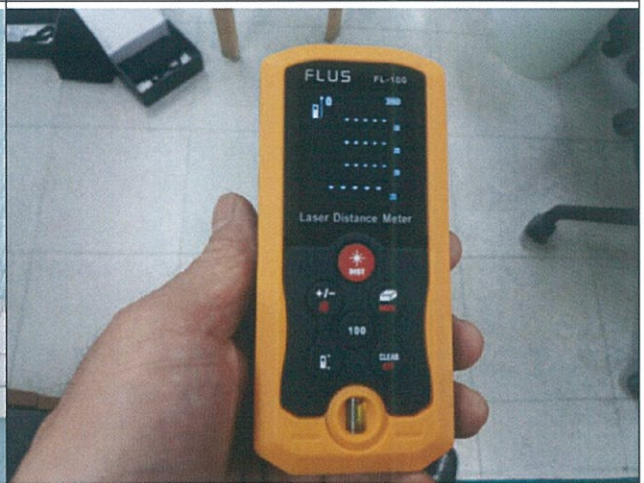
검사 진행 중(기능)