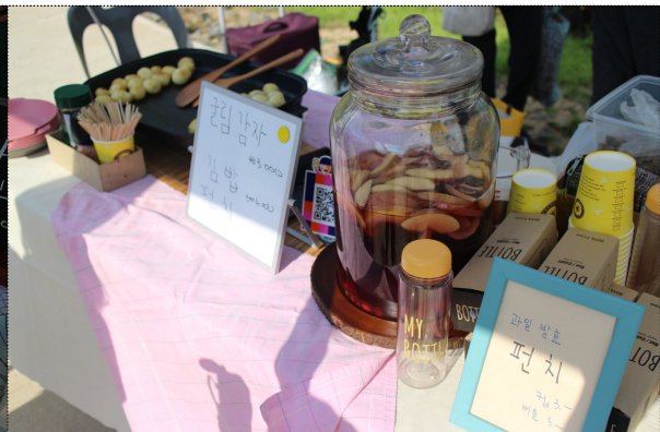
채식요리 및 음료를 판매하는 참가팀