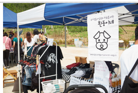
자유제안 프로그램을 참여중인 시민