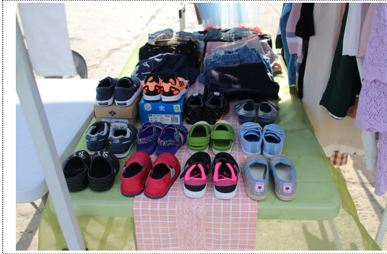
아이가 신던 신발을 판매하는 참가 부스