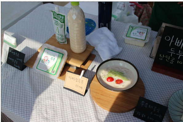
두부와 콩물을 판매하는 참가팀