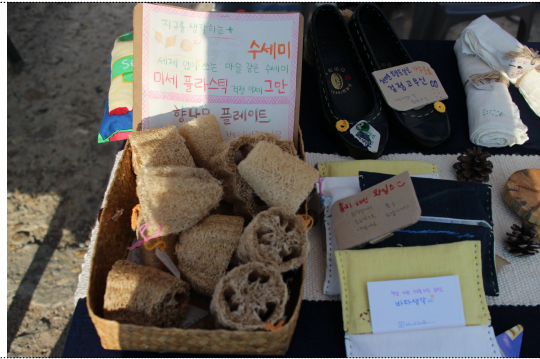
직접 채집한 수세미를 판매하는 참가팀