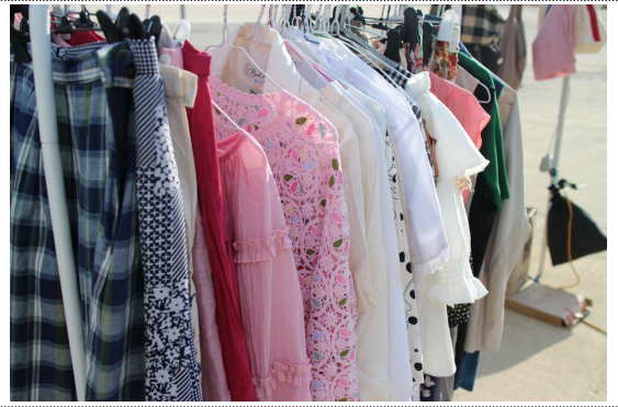
직접 사용한 옷을 판매한 참가 부스