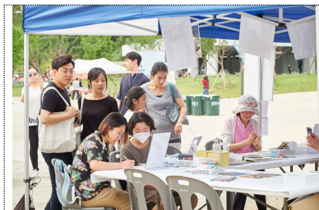
직접 체험할 수 있는 자유제안 프로그램