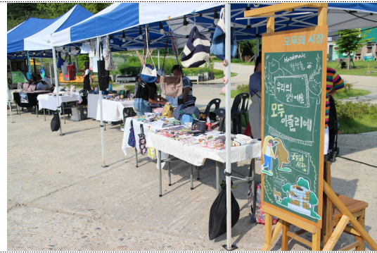
모두 아틀리에 창작품' 전경