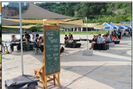
공연을 즐기는 시민