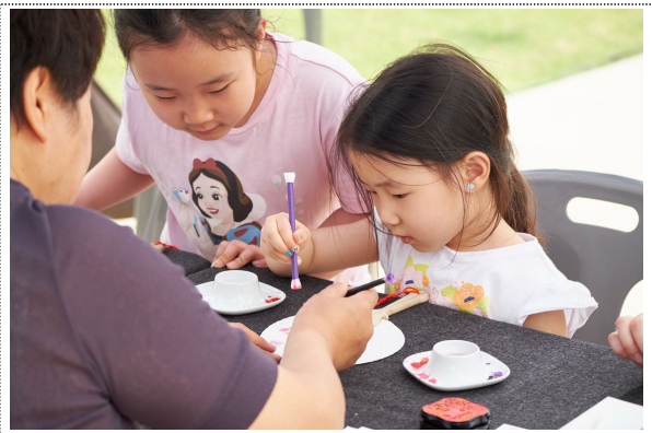
부채만들기 체험을 참여중인 어린이들