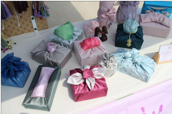
전통 포장인 보자기 매듭 체험 부스