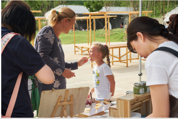
시식을 하는 외국인 시민