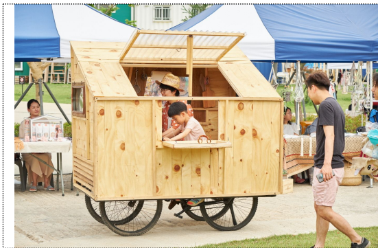
직접 체험할 수 있는 자유제안 프로그램