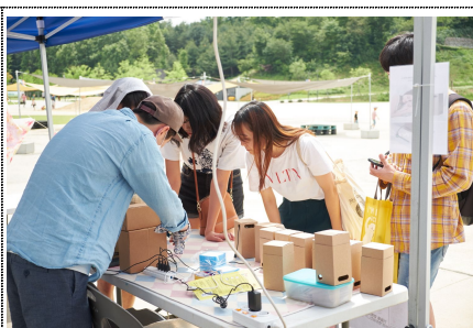
미니 공기청정기 만들기