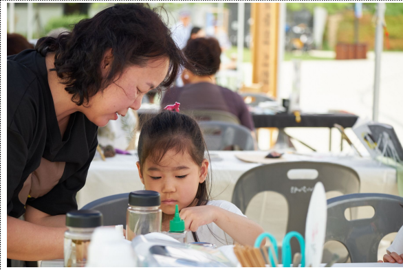
체험 참여 중인 어린이