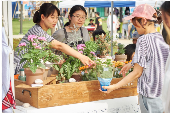
제작한 화분을 판매하는 참가팀