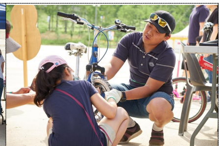
자전거 관리와 수리워크숍