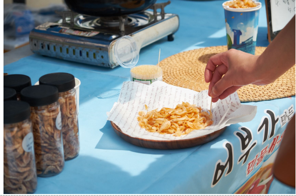
직접 잡은 민물새우를 판매하는 참가자