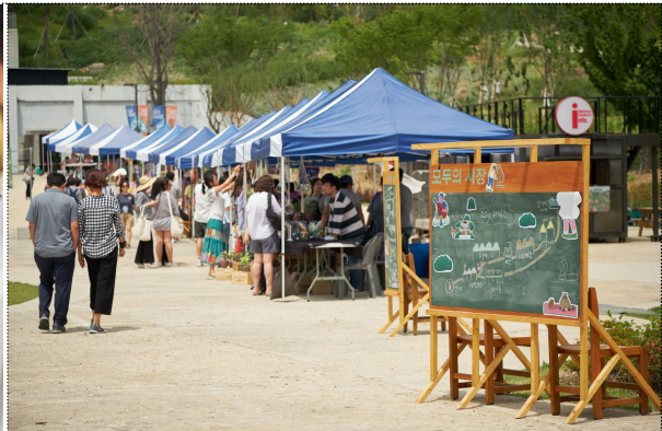
모두 아뜰리에 '창작품' 전경