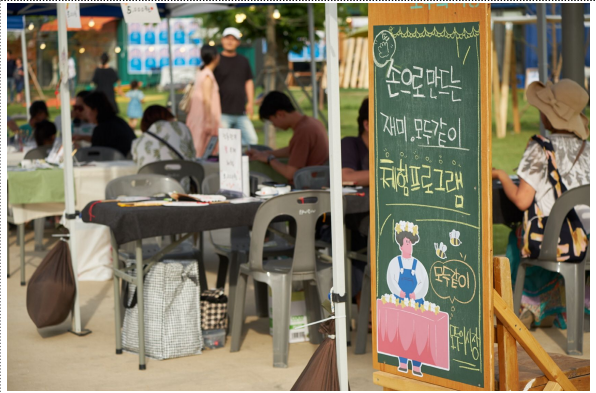
모두 같이 '체험 프로그램' 전경