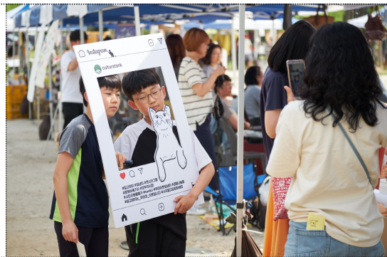
자유제안 프로그램을 참여중인 시민