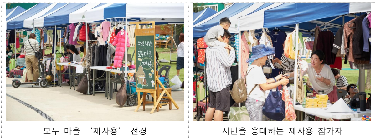
모두 마을 '재사용' 전경