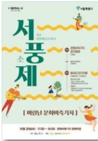
1부 서풍제 포스터