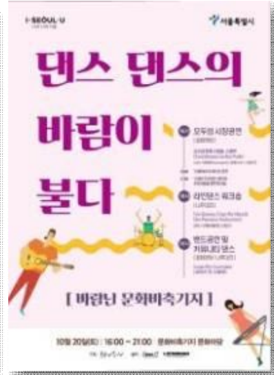
2부 댄스 포스터