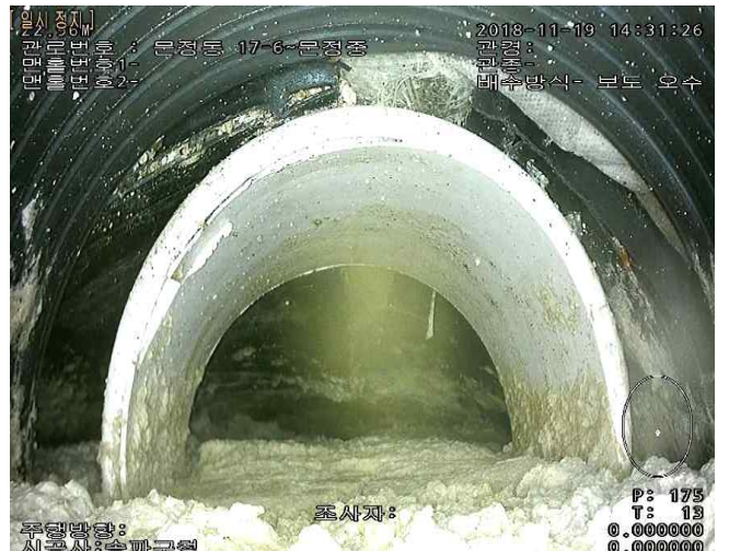
THP관 파손으로 인한 퇴적물 발생