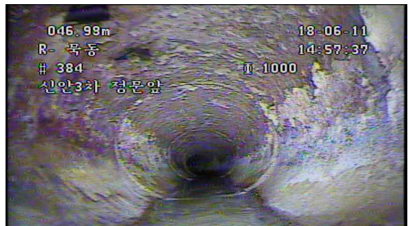
하수관 노후화로 인한 파손