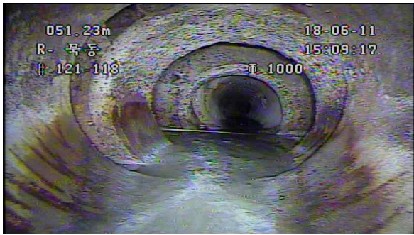
관 이음부 파손 및 침하