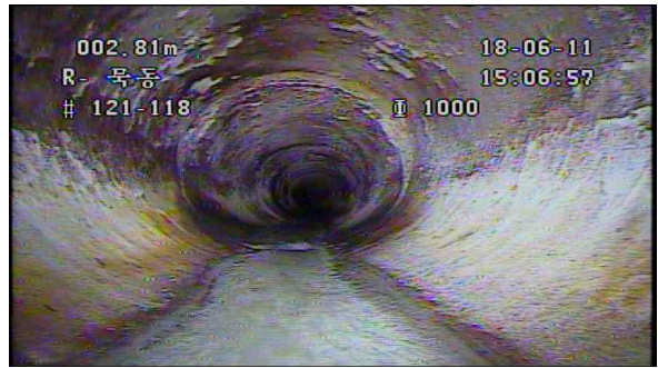
하수관 노후화로 인한 파손