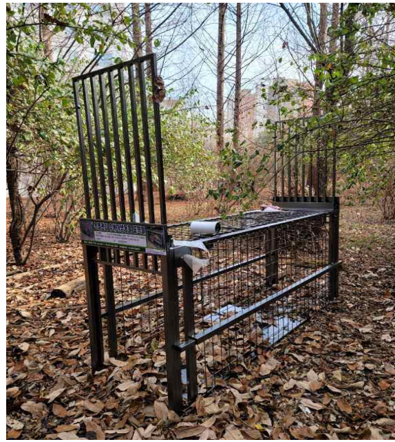
〈 포획틀 〉