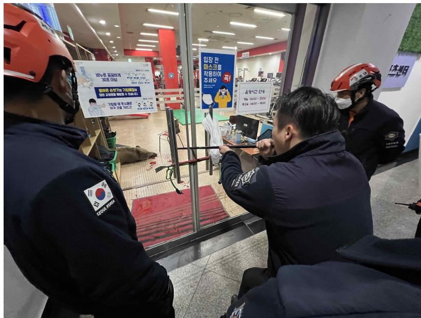
〈 스포츠센터에 들어온 멧돼지에게 마취총을 쏘는 모습 〉