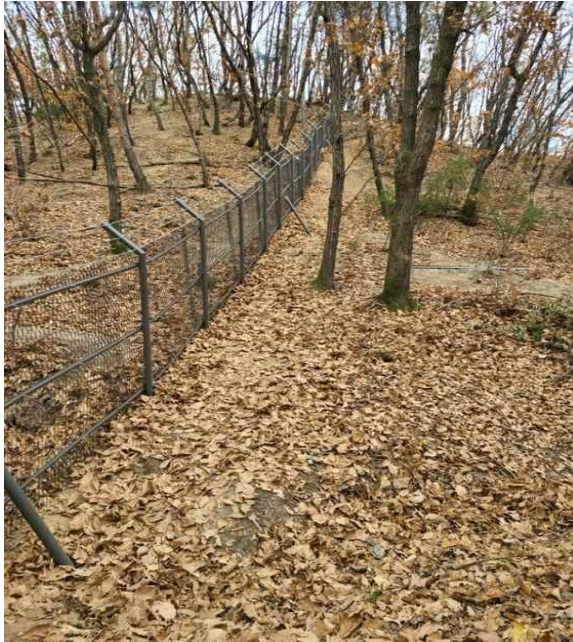
〈 차단 울타리 〉