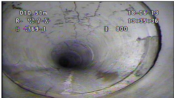
상부 균열(파손) 및 이음부 단차