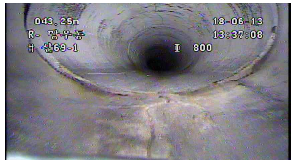
상부 균열(파손) 및 이음부 단차