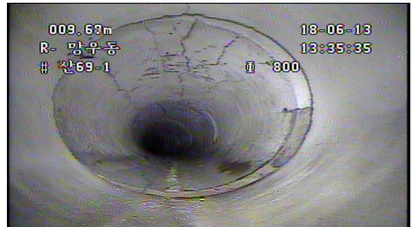
상부 균열(파손) 및 이음부 단차