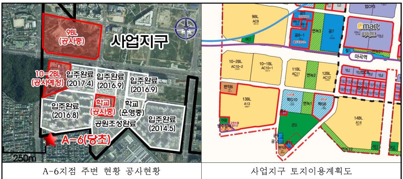
(그림 3) 조사지점(A-6지점) 주변지역 토지이용현황 및 공사현황