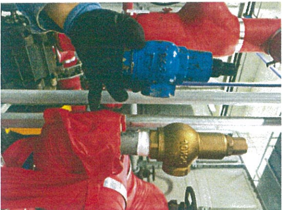
[철거 및 신규제품]