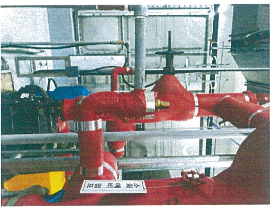
[신규 교체후 사진]