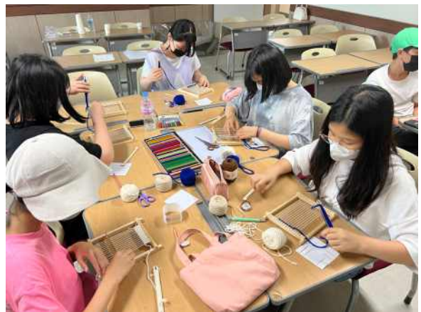
<미술영재 교육 - 활동수업>