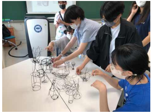
<미술영재 교육 - 여름방학 집중수업>