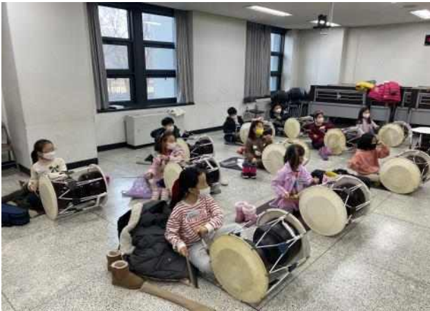
<음악영재 교육 - 국악실기>