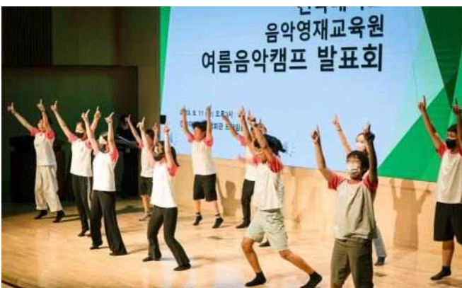
<음악영재 교육 - 여름음악캠프>