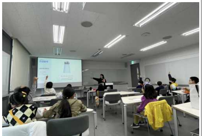
<미술영재 교육 - 전공탐색>