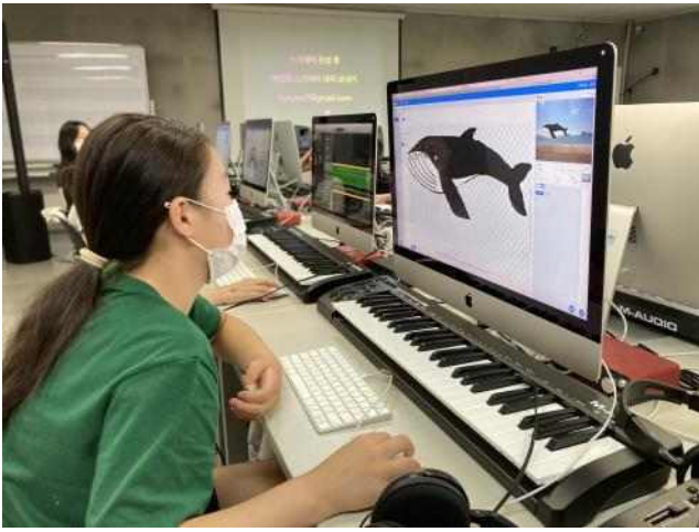
<음악영재 교육 - 컴퓨터음악>