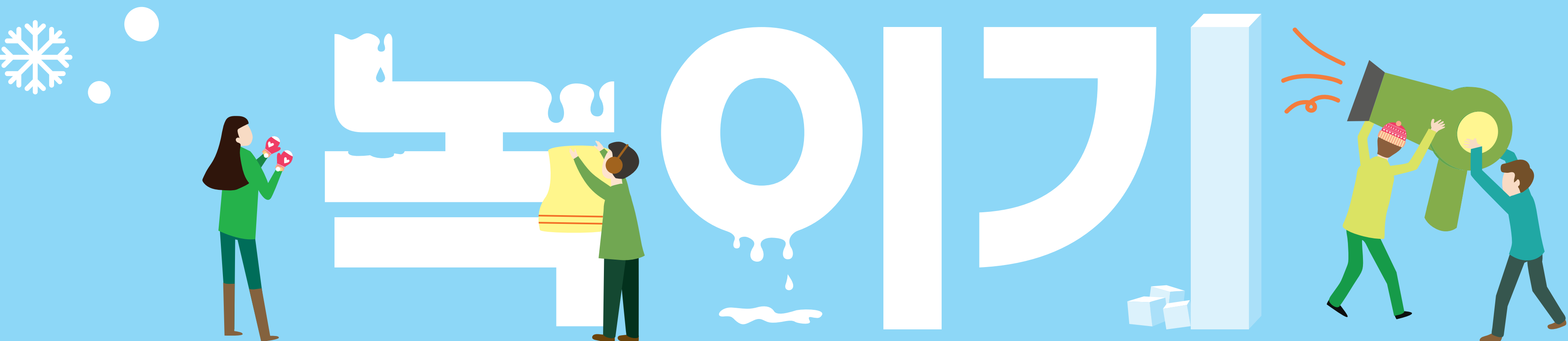
계량기가 얼었을 때는 따뜻한 물수건을 사용해 녹여주세요