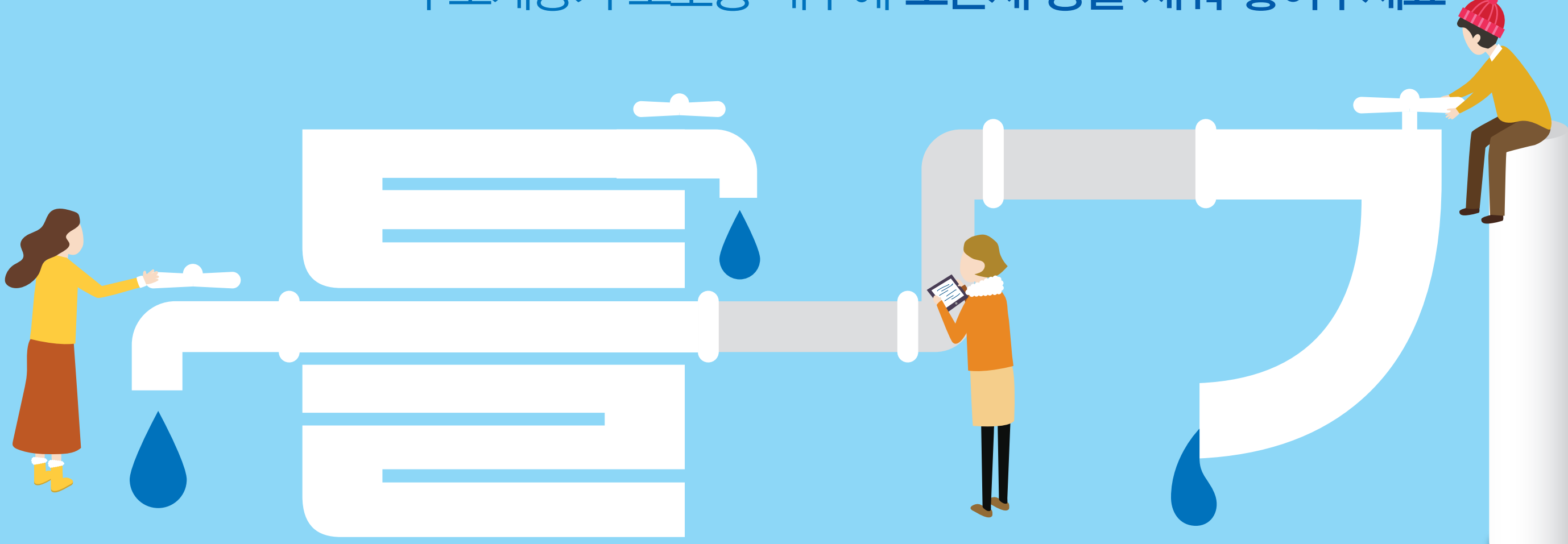
혹한시에는 수도꼭지를 조금 틀어주세요