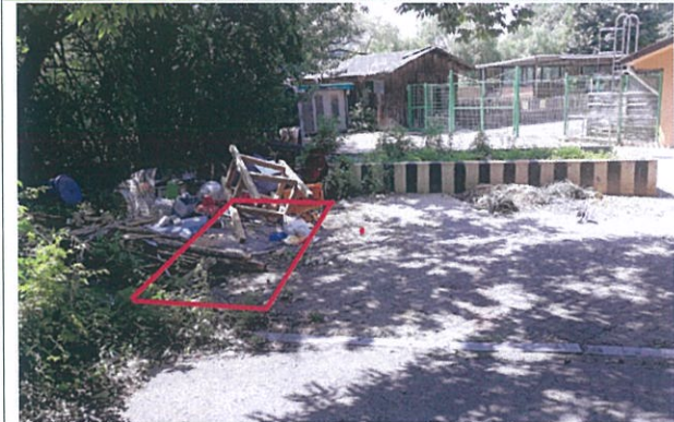
7. 동물교실 현위치 왼쪽(호수쪽)