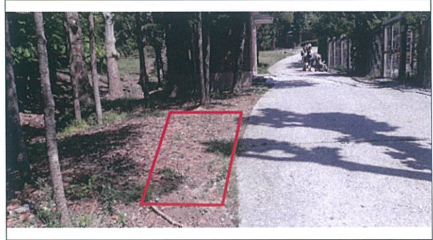
2. 낙타사 현위치 ~ 직원 사무실 사이