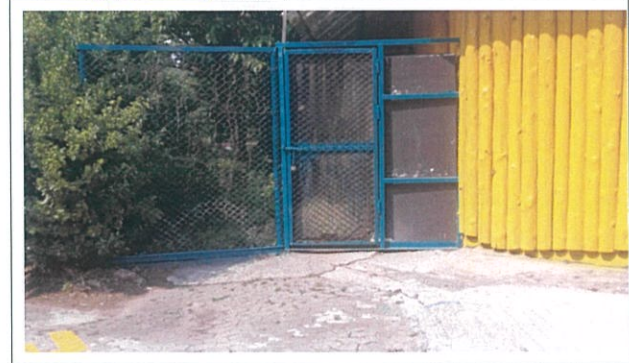
4. 호주관 현위치