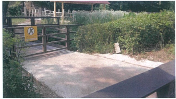
1. 하마사 관람로 입구쪽