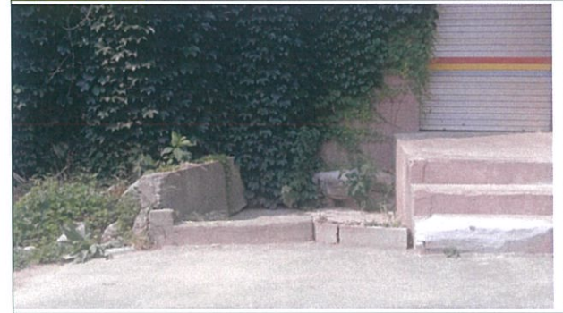
6. 사자사 현위치