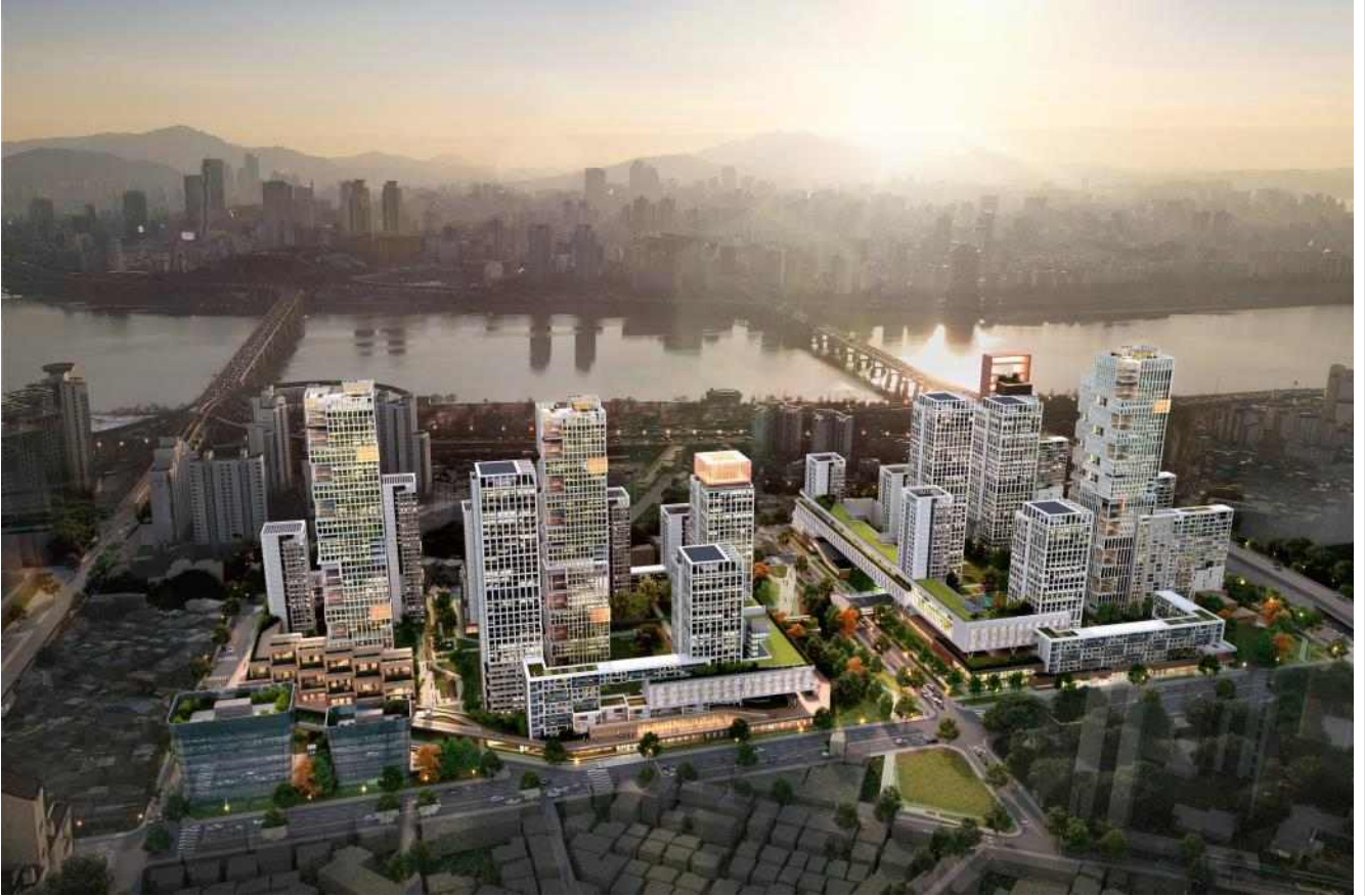
〈 보행동선계획(안) 〉 동-서축의 단지 내 보행축 조성으로 열린단지 계획