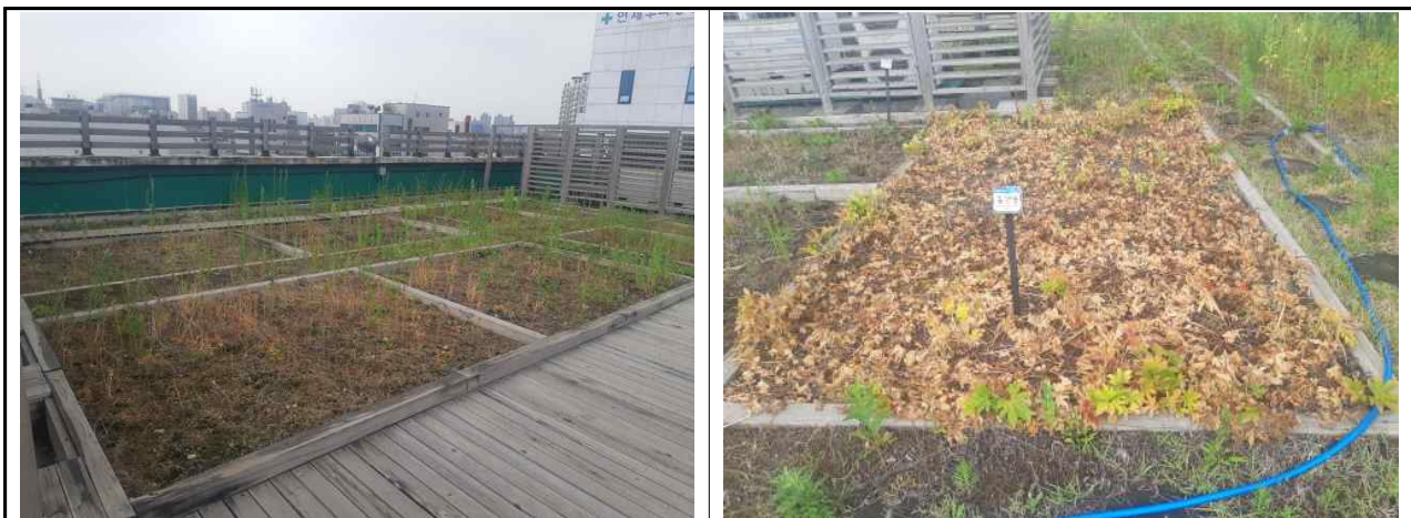
장안중(비어있는 텃밭상자모습과 돌단풍 건조피해모습)