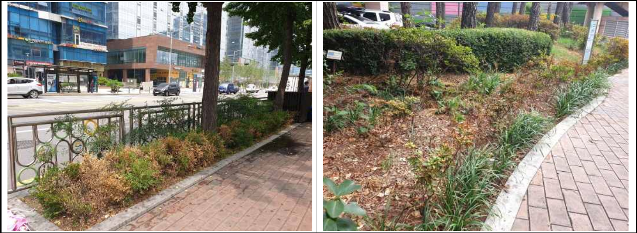
우림라이온스밸리 2차(잡초 및 이입식물과 쓰러져 있는 식물 표지판)