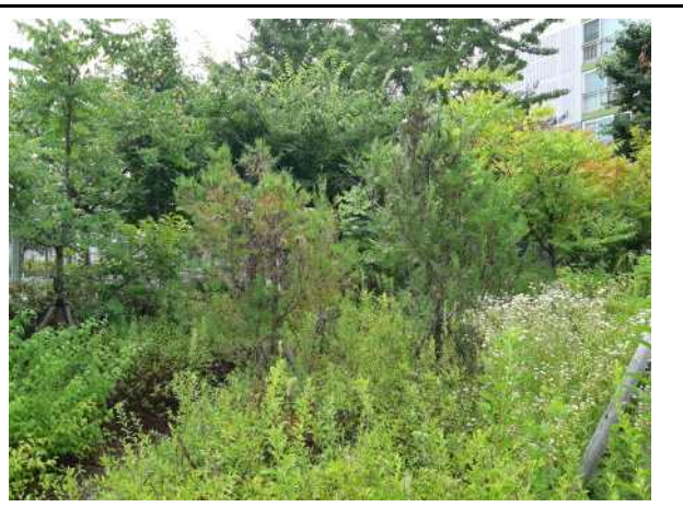
누원고(느티나무 신초발생이 안된 모습과 측백 생육불량 모습)