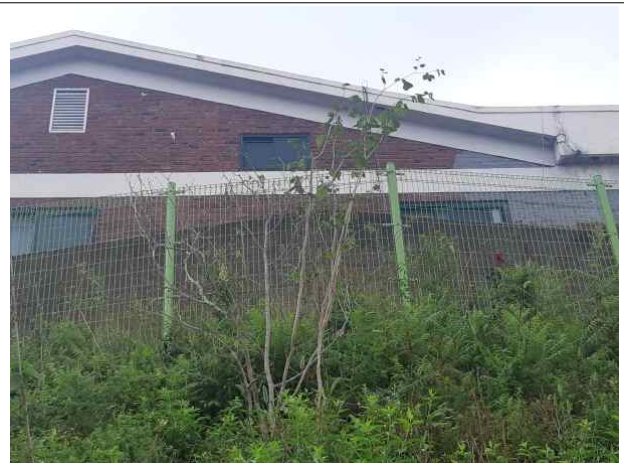
목동초교(배롱나무 고사목과 반송, 수수꽃다리 등 생육불량모습)