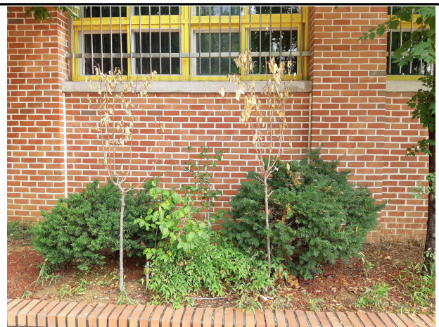
석관중(고사목 발생과 건조피해모습 및 고사목 모습)