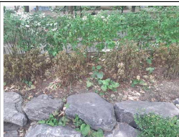
상계주공APT2단지(나지화 된 모습과 건조피해 및 생육불량 모습)