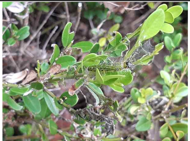
도봉초교(단풍나무 고사목 모습과 회양목명나방 피해모습)