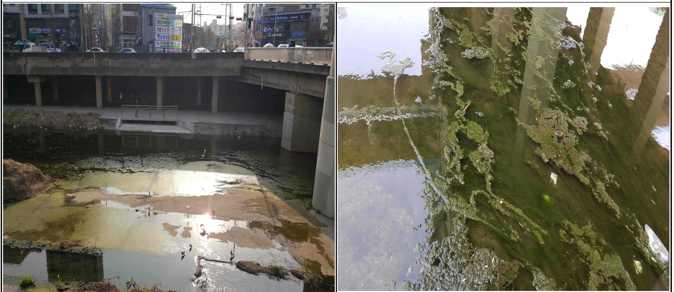
도림천 대림역 하부 낮은 수심과 정체로 인해 녹조 대량 발생