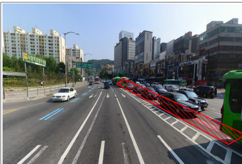
사 진 ⑮