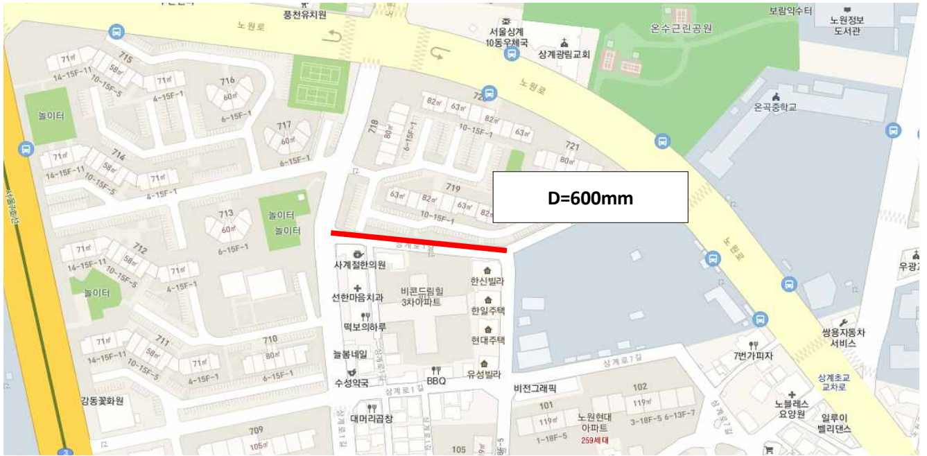
현 황 도