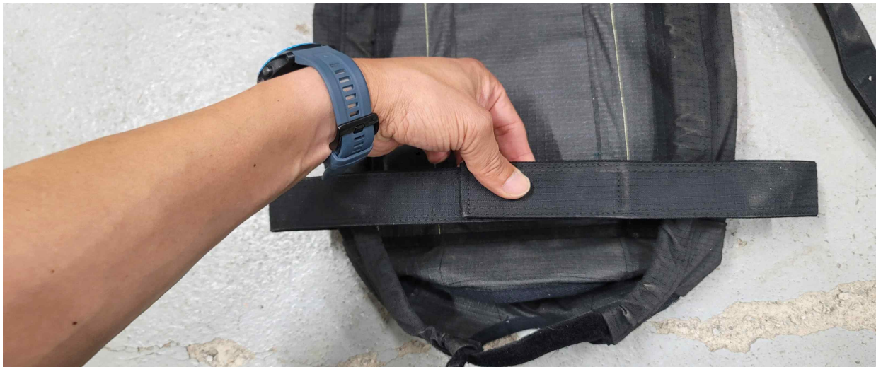
안쪽 벨크로를 적당한 크기에 맞춰 벨크로를 결합한다.