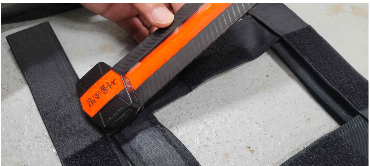
대원위치식별등 아래부분을 먼저 끼운다