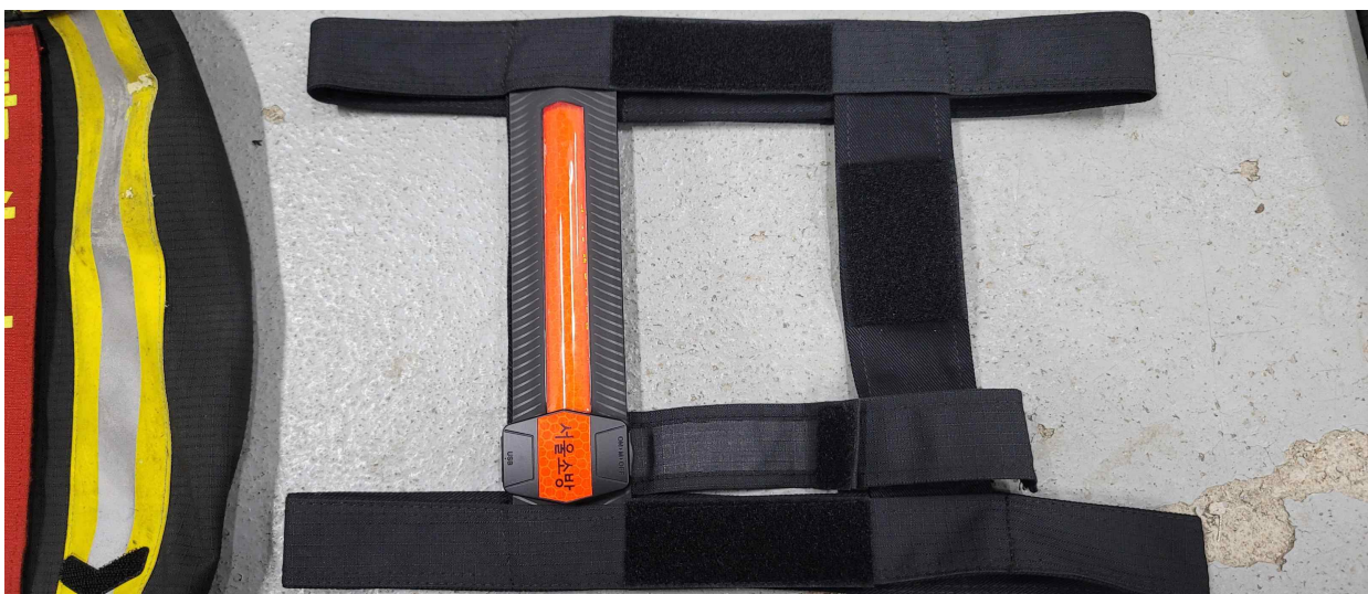
대원위치식별등 중간부분을 벨크로에 밀착시킨다.