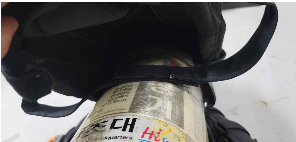
수납파우치 벨크로를 공기통 위쪽(공기호흡기 커버 안쪽)으로 놓고 덮는다.