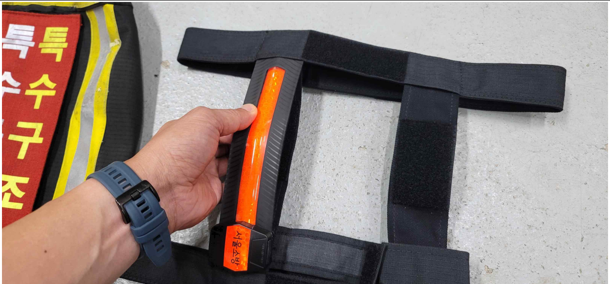
대원위치식별등 위부분을 끼운다.