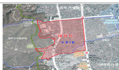
강북구 수유1동 (508,000m 2 ) 근린재생형 시범사업지