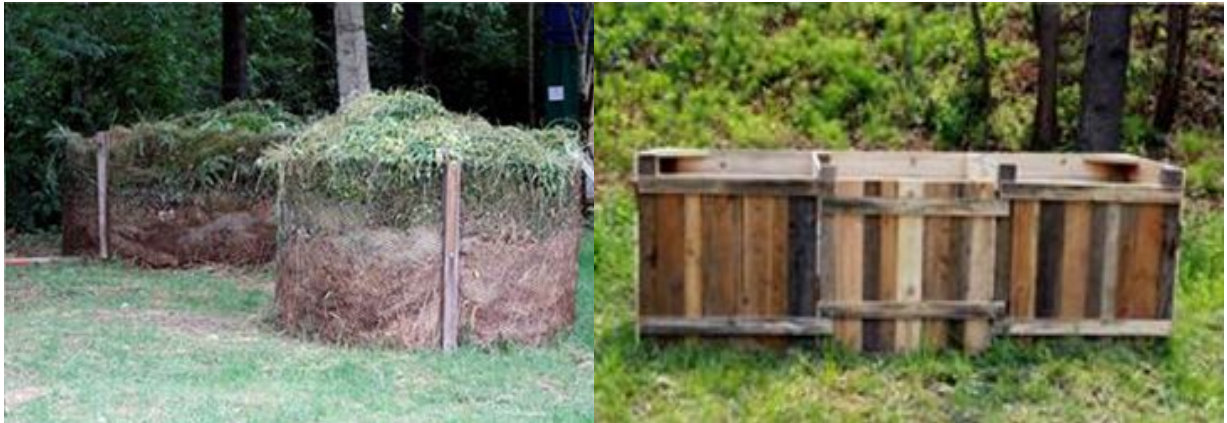
현재 설치된 퇴비장 모습