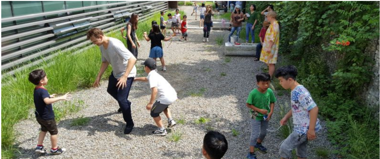
서서울호수공원 다목적실 뒤편('17년 예술로 놀이터 운영 사진)