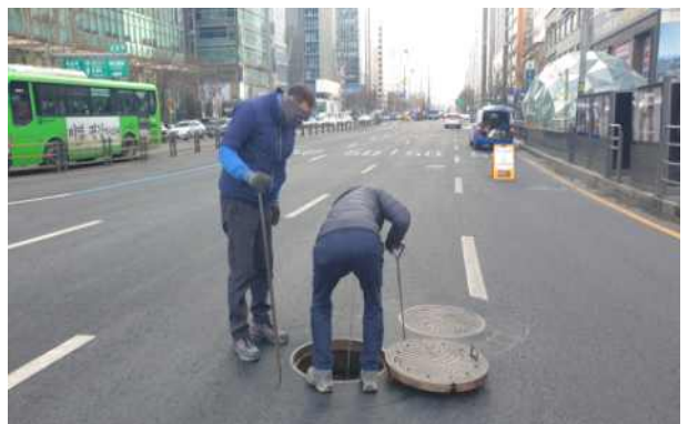
주변 관로 음청식 탐지 및 200mm 관로 다점식 음수집센서 2개소 예약탐사 설치 중