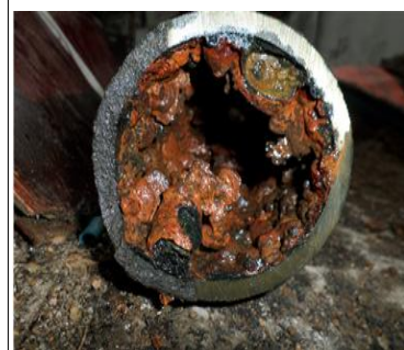
단면 축소 상태