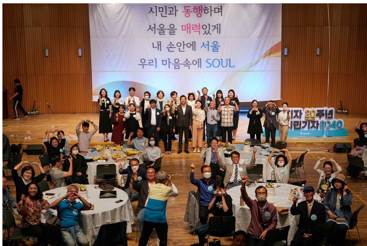
시민기자 20주년 소통행사에 참석한 서울시민기자 기념 촬영('23.5.17.)