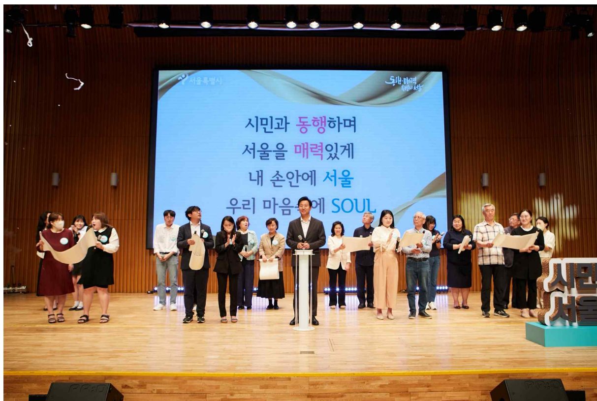
오세훈 시장과 시민기자 대표 20명의 '서울시민기자 선언문' 낭독 ('23.5.17.)